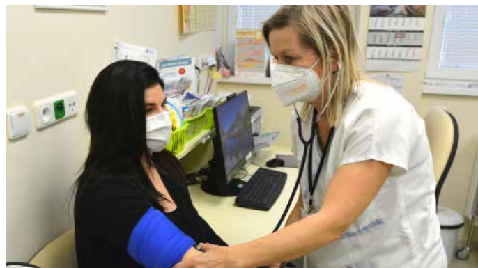
Vzdálené měření tlaku využijí hlavně těhotné ženy