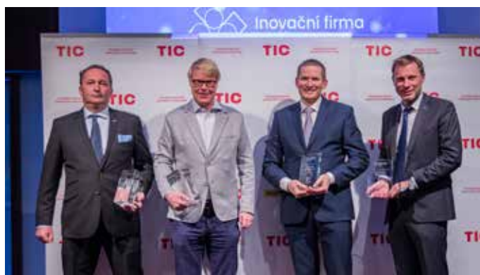
Zástupci úspěšných firem, které vynikají v inovacích, byli oceněni.