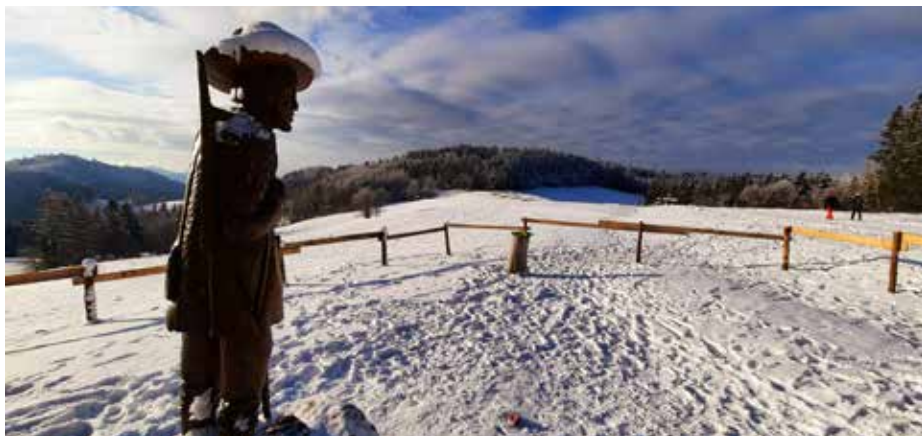
Zimní výhledy z Klapinova na rusavskou krajinu.

Mnoho cyrlometodějských pověstí je spojeno právě s tímto pohořím mezi Koryčany a Napajedly. A není se co divit, Konstantin (Cyril) a Metoděj kolem zdejšího hradiště sv. Klimenta přímo působili. Na „Klimen-tek“ se vydejte od parkoviště U křížku 4,5 km od Koryčan. Také lze putovat přes zříceninu hradu Cimburk a působivou skálu – Kazatelnu. Od rozcestníku Pod Kazatelnou můžete pokračovat po červené až k dopravnímu spojení u rozcestníku Buchlov-bus. Nenáročných je i 8 km po cyrlometodějské trase od hradu Buchlova na Velehrad . Posilněte se v buchlovském podhradí a pokračujte po červené kolem Břestecské skály a obřího sekvojovce v Chabaních až na Velehrad. Možná tu ještě stihnete výstavu ve Velehradském domě sv. Cyrila a Metoděje (o historii poutního místa a Bibli) nebo v turistickém centru – o díle sochaře Otmara Olivy či velehradském perníku. Aktuální otevírací doby doporučujeme si ověřit ve farním informačním nebo obecním turistickém centru.