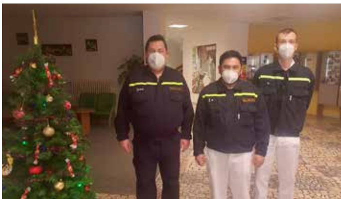
V sociálních službách pomáhají dobrovolní hasiči, například v rožnovském Domově pro seniory nabídli svou výpomoc borci z Koryčan.