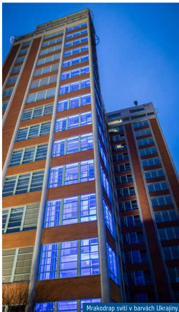
Mrakodrap svítí v barvách Ukrajiny.