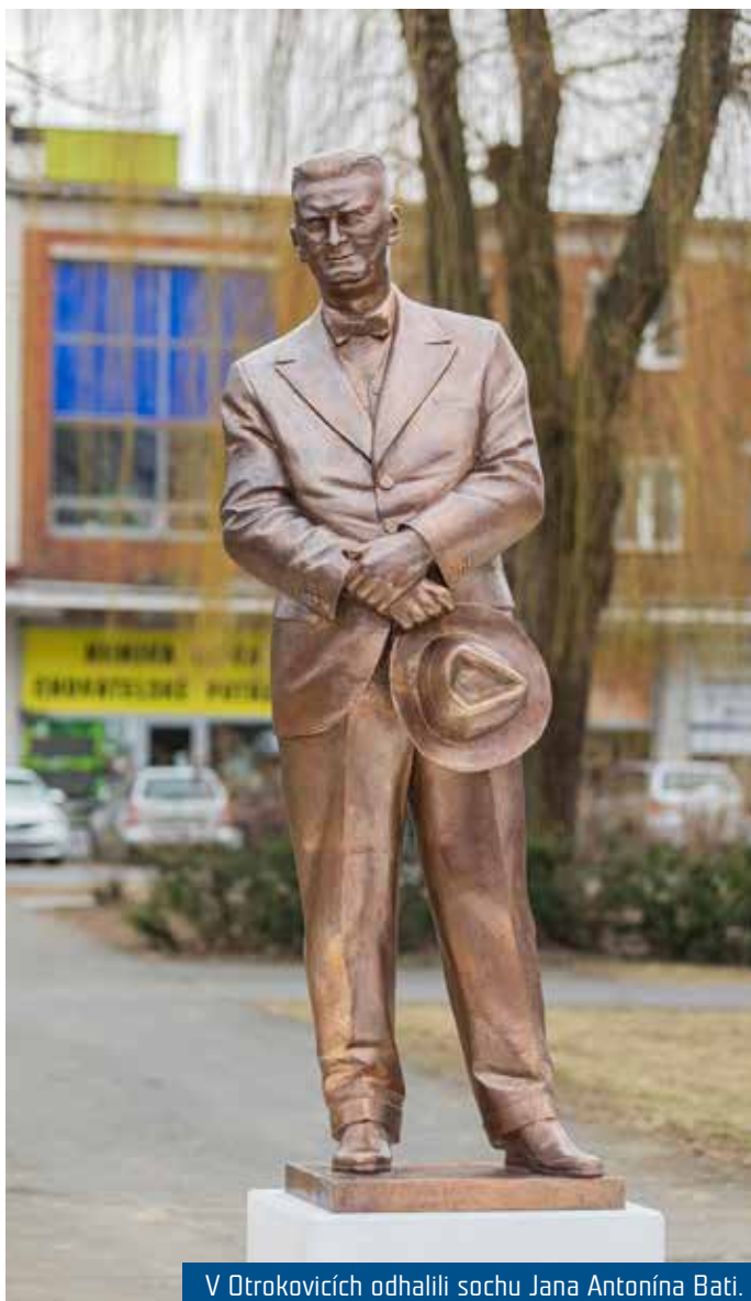
V Otrokovicích odhalili sochu Jana Antonína Bati.