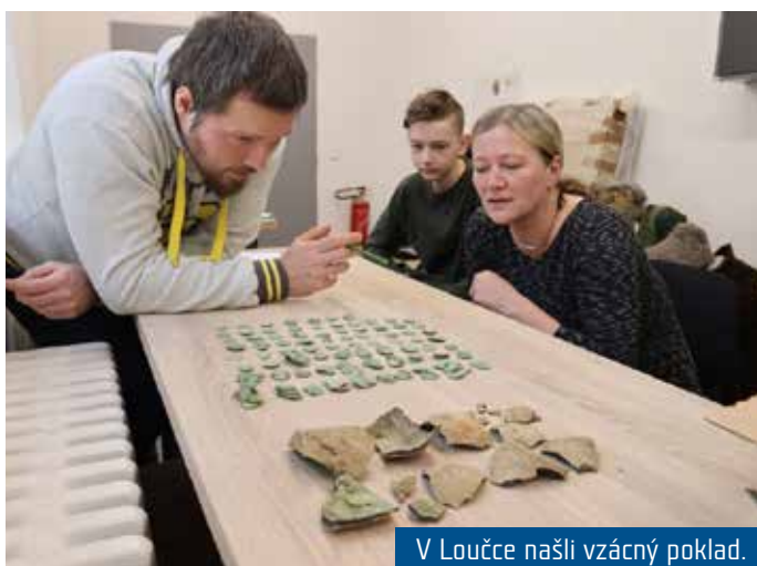
V Loučce našli vzácný poklad.