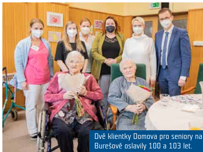
Dvě klientky Domova pro seniory na Burešově oslavily 100 a 103 let.