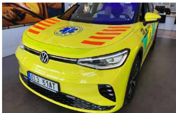
Záchranáři ze Zlínského kraje začali jako první v ČR používat elektromobil.