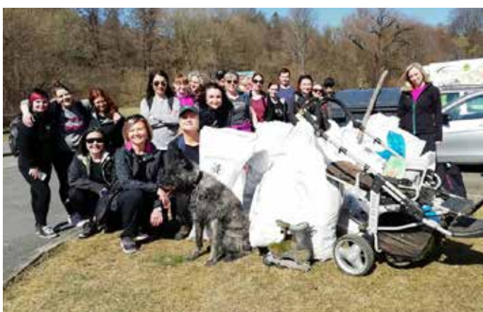
Zaměstnanci krajského úřadu se opět zapojili do akce Uklidme svět.