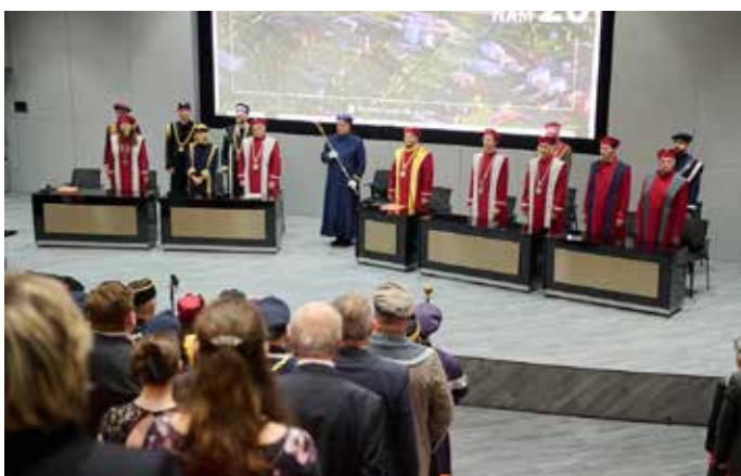
Univerzita Tomáše Bati letos slaví 20 let.