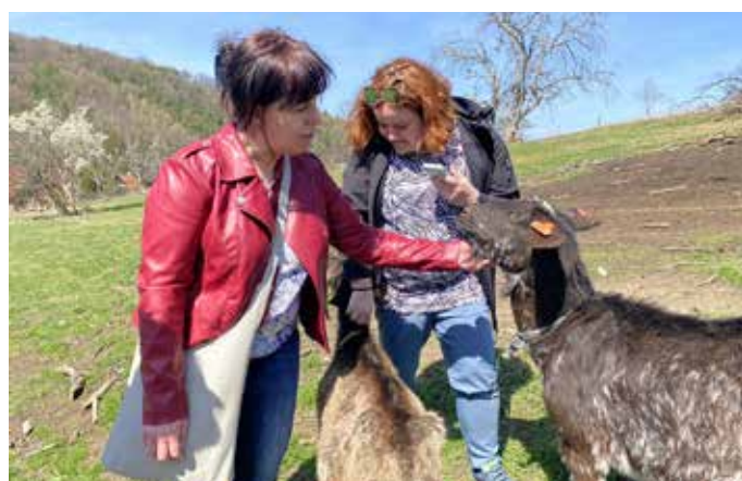
Navštívili jsme kozí farmu Vizovice.