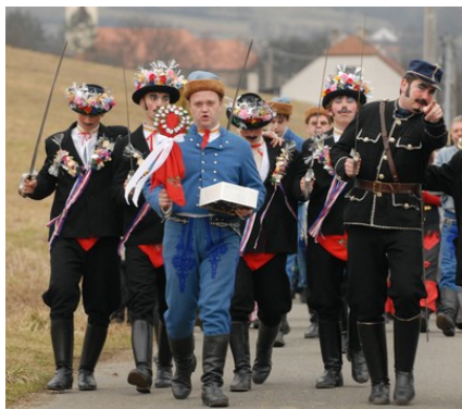
Obrázek č. 6 – Fašankové slavnosti

Dominantou obce je kostel sv. Jakuba Většího z roku 1846. Zachovaly se i stavby lidové architektury. Z lidových tradic je nejznámější fašanková slavnost a udržují se i jiné zvyky jako např. velikonoční „repání“, „vyklepávání“, „mrskačka“. Další se postupně obnovují. Okolí obce skýtá návštěvníkům příjemné pěší túry s pohledem na Komenského údolí. Romantická lokalita „Modrá voda“ je zajímavým přírodním útvarem