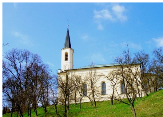
Obrázek č.8. – Kostel sv. Stanislava

Turisté postrádají větší ubytovací kapacity