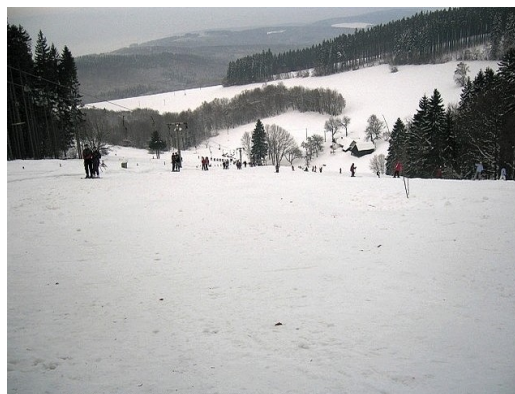
Obrázek č. 11 – Mikulčin vrch, zdroj: www.chatalopata.ic.cz

Druhým zařízením je Agropenzion Vápenice, který se nachází v oblasti Bílých Karpat v nadmořské výšce 680 m n. m. Poblíž penzionu jsou 2 lyžařské svahy s vleky, vede tudy běžecká trať o délce 7 km. Přístupová komunikace vede až k samotnému penzionu, možnost parkování osobních automobilů je v oploceném areálu penzionu. V areálu penzionu je také chata o kapacitě 2x5 lůžek.