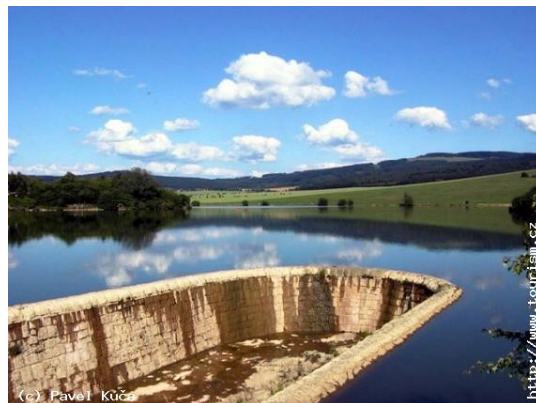
Obrázek č. 4 – Vodní dílo Ordějov

V okolí obce vyvěrá 36 studánek, vede tudy tzv. Studánková stezka. Na vodní nádrži