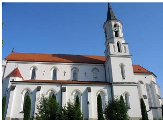
Obrázek č. 3 – Chrám sv. Cyrila a Metoděje

chráněných lokalit, např. přírodní památky Cestiska, Dubiny a Kalábová, která je známá