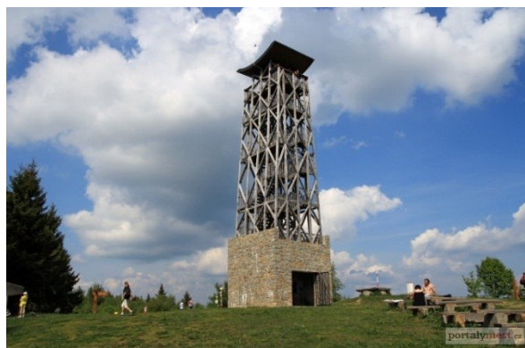
Obrázek č. 7 – Rozhledna Lopeník

Jednou z místních dominant je dvaadvacetimetrová rozhledna z dubového dřeva stojící přímo na státní hranici, která má připomínat přátelství Čechů a Slováků. Krajinou Moravských Kopanic pod Velkým Lopeníkem turisty i cyklisty provede naučná