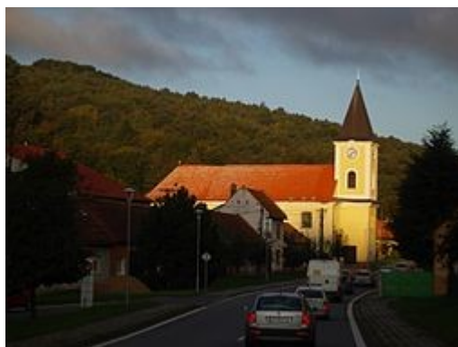
Obrázek č. 9 – Starý Hrozenkov, zdroj: www.wikipedia.org

Existuje poptávka po stylové restauraci, další směr rozvoje turismu může představovat skutečnost, že v samotném centru Kopanic chybí skanzen. Dále by šlo využít stávající parkoviště, kde nyní parkují kamiony, rekonstruovat jej a vybudovat informační kopaničářské centrum s návazností na motorest Rasová.