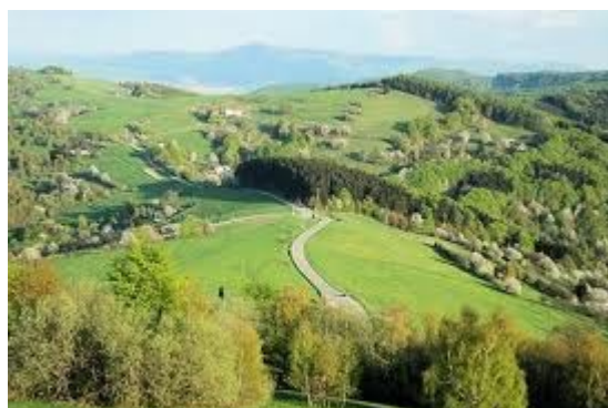
Obrázek č. 12 – obec Vyškovec, zdroj: www.vyskovec.cz

Pro náročnější je připravena turistická trasa, pro cyklisty je zde cykloturistická trasa a v zimě je k dispozici lyžařská trasa. Dále se zde nachází naučná stezka. Skutečností je, že turisté obcí jen projíždějí. Negativně se do návštěvnosti projevilo zrušení vleku,