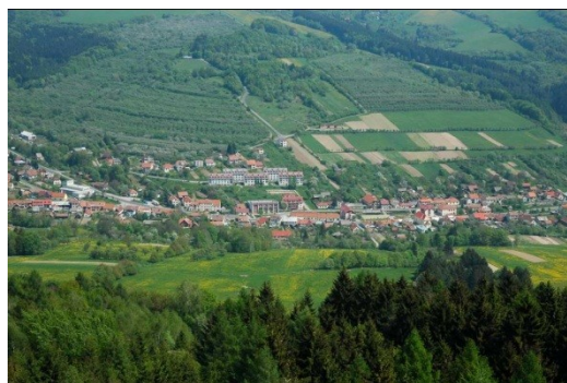
Obrázek č. 13 – Obec Žitková

V obci Žitková se dochovala řada příkladů lidové architektury Moravských Kopic. Souborem původních domů jsou stavení č. p. 29, 43, 48, 49, 72 a stodoly č. p. 21, 70, 76. Nová kaple Panny Marie Kopicnické zapadá do krajiny a neruší historický ráz obce. Na katastru obce se nachází několik zajímavých přírodních území. Jsou to především přírodní rezervace Hutě a Pod Žitkovským vrchem, ale zajímavé jsou i