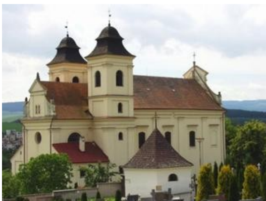
Obrázek č. 2 – Kostel sv. Vavřince

nebyl zámek provozován, byl součástí konkurzní podstaty. Poslední oprava byla provedena s dotací z ROP Střední Morava, mj. byla zrekonstruována obřadní síň, zámecká kaple a společenský sál. Zámek je využíván ve spolupráci s městem Bojkovice i pro veřejné účely, např. svatby. Problémem bránícím dalšímu rozšíření ve využití zámku je špatná přístupová komunikace, kterou chce město ve spolupráci s majitelem řešit.