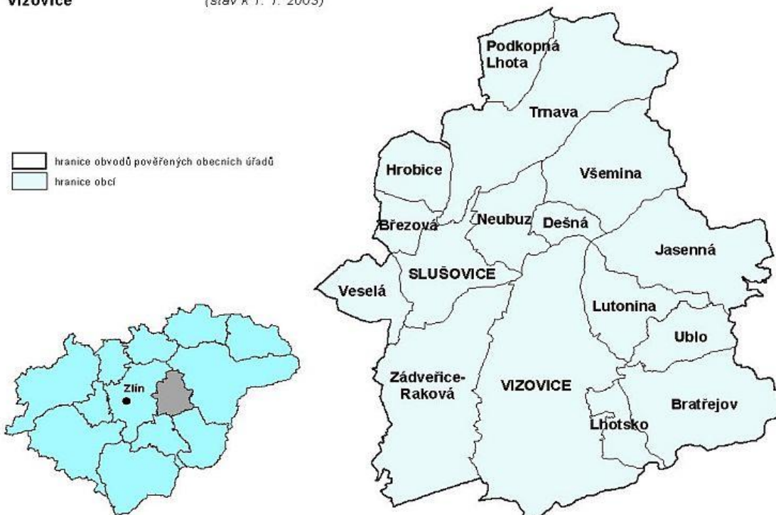
Administrativní mapa správního obvodu Vizovice (stav k 1. 1. 2003)