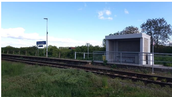
Pohled na přístřešek a tabuli s názvem zastávky.