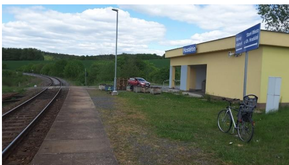
Pohled na nástupiště zastávky směrem k Bynici.