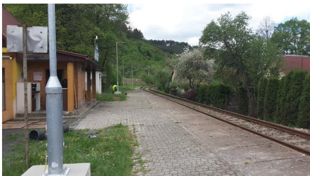
Pohled na nástupiště zastávky Ústí u Vsetína směřem ke Vsetínu.