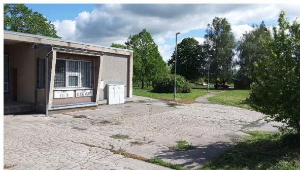
Pohled na stezku spojující vlakovou a autobusovou zastávku.