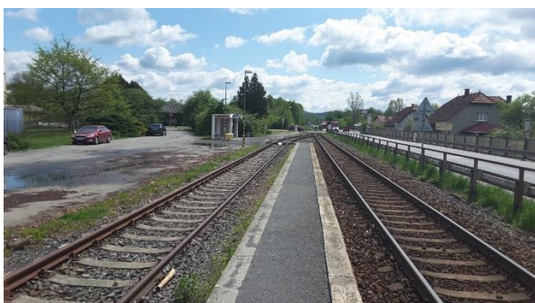
Pohled na nástupiště zastávky směrem k Rožnovu pod Radhoštěm