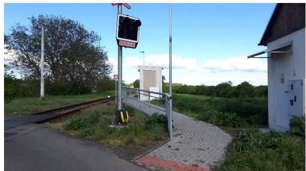
Pohled na bezbariérový přístup na nástupiště.