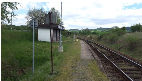
Pohled na nástupiště zastávky Valašské Příkazy směrem k Horní Lidči.