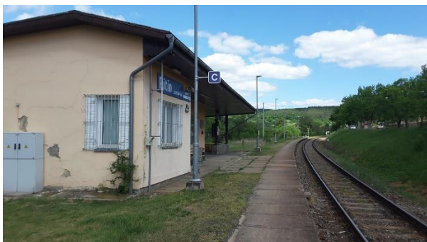
Pohled na nástupiště zastávky směrem k Bylnici.