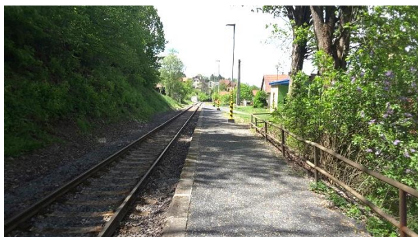
Pohled na nástupiště zastávky Huslenky směřem ke Vsetínu. Vpravo pod náspem se nachází autobusová zastávka, chybí však přímé propojení.