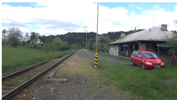
Pohled na nástupiště zastávky Huslenky zastávka ve směru Vsetín.