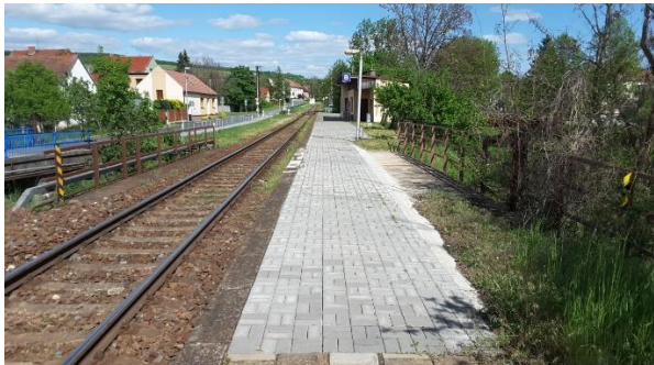
Pohled na nástupiště směrem k Bylnici.