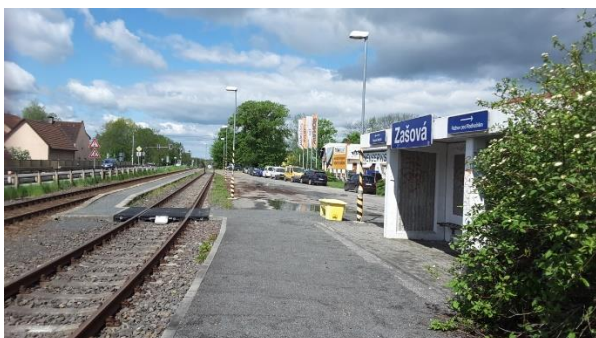
Pohled od přejezdu silnice III/01876 na zastávku s nákladištěm Zašová a na zastávkový přístřešek s označením názvu zastávky.