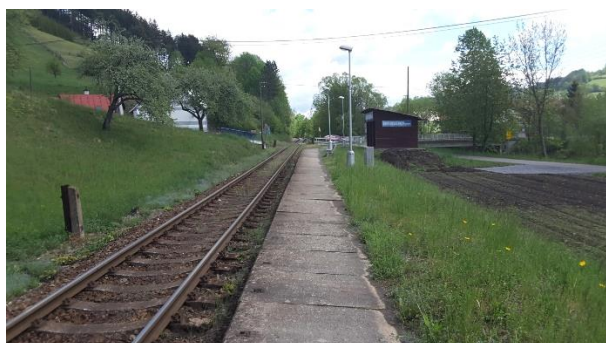
Pohled na zastávku Nový Hrozenkov zastávka směřem k Velkým Karlovicím.