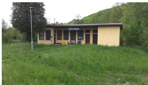
Pohled na objekt zastávky Návojná.