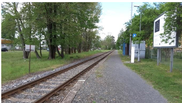
Pohled na nástupiště zastávky od ulice Hlavní směrem k Valašskému Meziříčí.