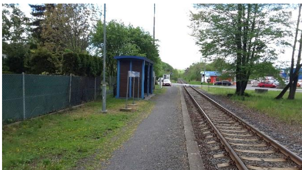
Pohled na nástupiště zastávky směrem k Rožnovu pod Radhoštěm