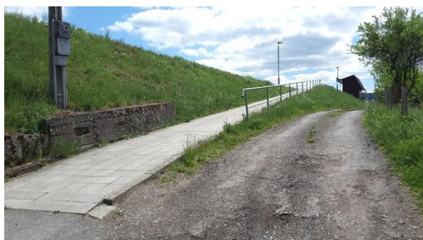
Pohled na přístupovou komunikaci k zastávce Brumov střed.