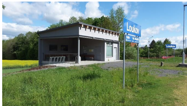
Pohled na objekt zastávky a tabuli s názvem zastávky.