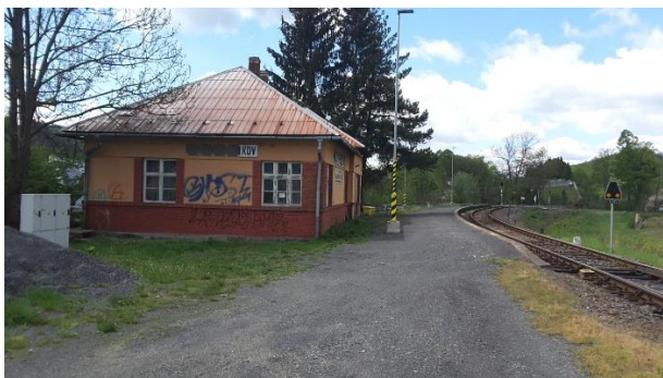
Pohled na nástupiště zastávky Nový Hrozenkov směrem ke Vsetínu.