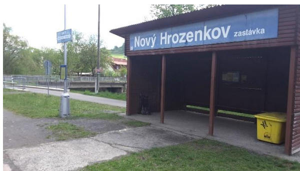
Pohled na přístřešek zastávky Nový Hrozenkov zastávka.