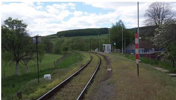
Pohled na nástupiště zastávky směrem ke Kunovicím.