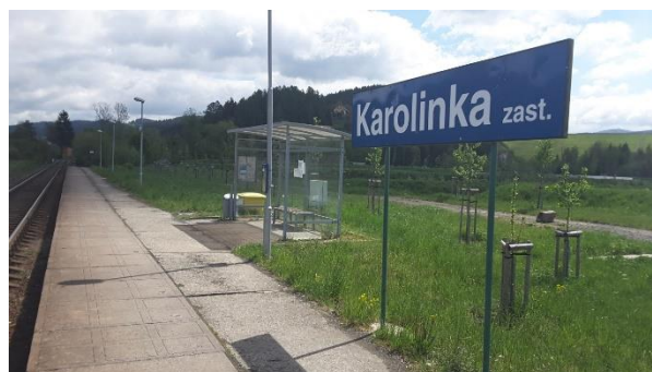
Pohled na přístřešek a tabuli s názvem zastávky.