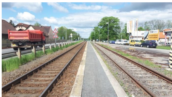
Pohled na nástupiště zastávky směrem k Valašskému Meziříčí