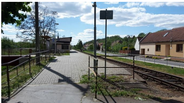
Pohled od přejezdu místní komunikace na nástupiště zastávky směrem ke Kunovicím.