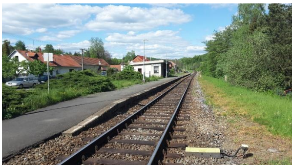
Pohled na nástupiště zastávky směrem ke Kunovicím.