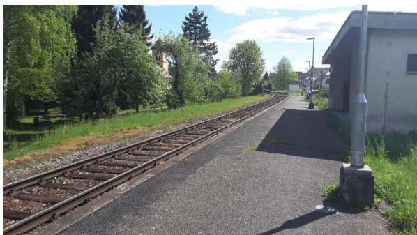
Pohled na nástupiště zastávky směrem k Újezdci u Luhačovic.