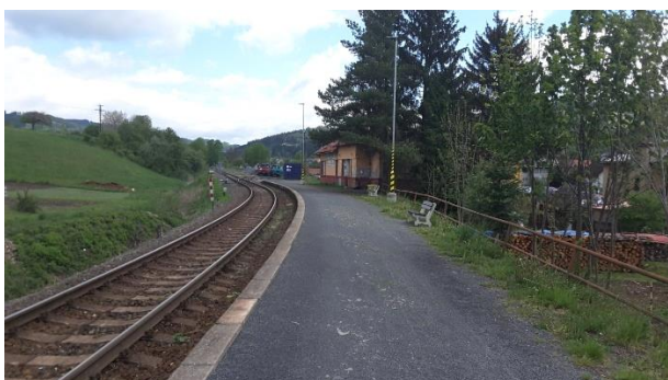
Pohled na nástupiště zastávky a nákladiště Nový Hrozenkov směrem k Velkým Karlovicím.