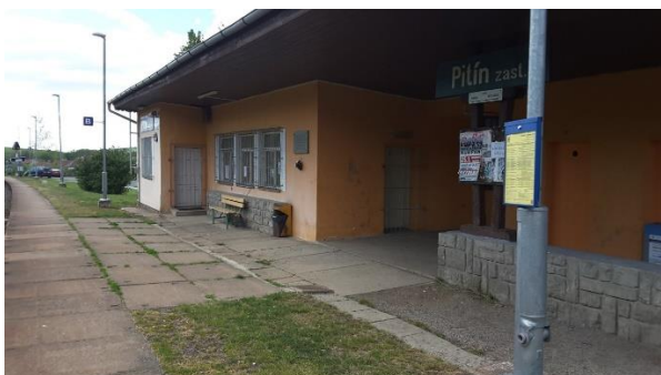
Pohled na objekt zastávky.