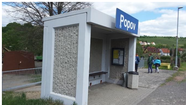
Pohled na přístřešek zastávky.