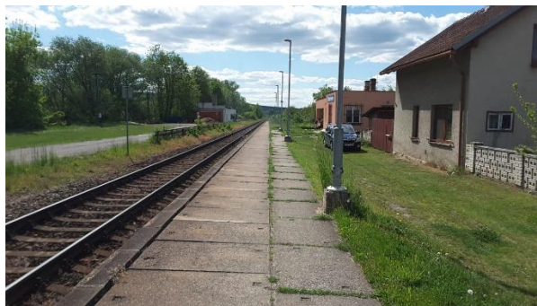
Pohled na nástupiště zastávky směrem ke Kunovicím.