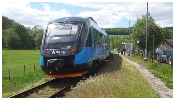
Motorová jednotka ř. 846 v zastávce Popov.