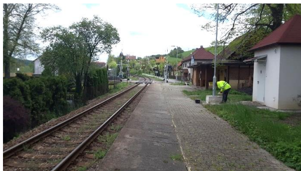
Pohled na nástupiště zastávky Ústí u Vsetína směřem k Velkým Karlovicím.