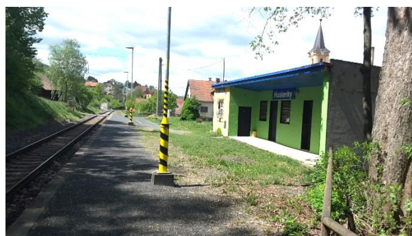
Pohled na objekt zastávky Huslenky.