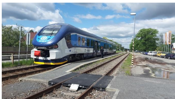
Motorová jednotka 844.021-6 na zastávce Zašová