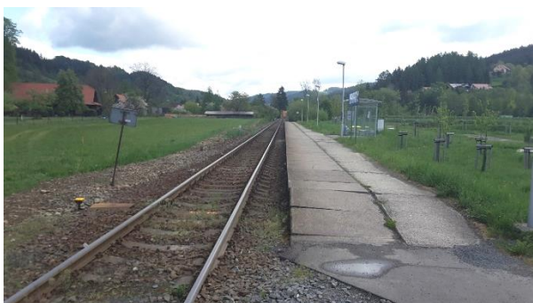
Pohled na nástupiště zastávky směrem k Velkým Karlovicím.