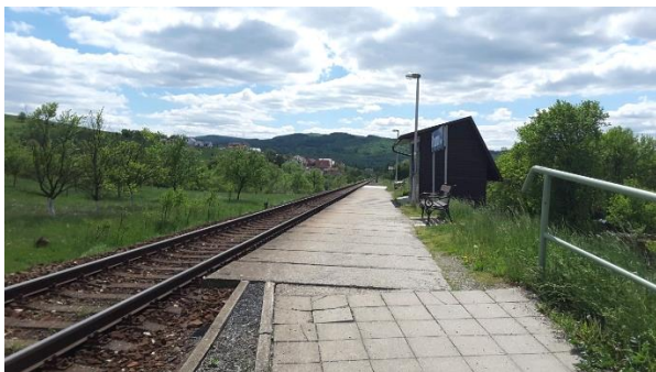
Pohled na nástupiště zastávky Brumov střed směrem k Bylnici.