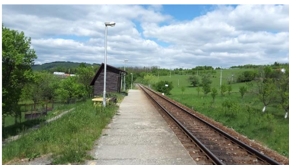
Pohled na nástupiště zastávky Brumov střed směrem k Horní Lidči.