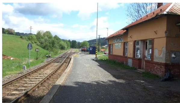
Pohled na objekt zastávky Nový Hrozenkov.