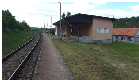
Pohled na nástupiště zastávky směrem ke Kunovicím.