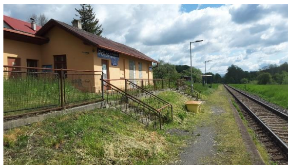
Pohled na původní objekt zastávky, který je dnes uzamčen.