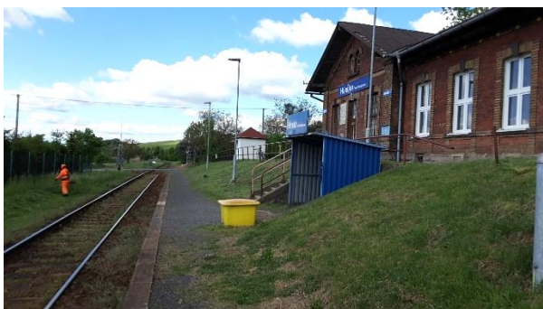
Pohled na nástupiště směrem ke Kojetínu. Hned za původním objektem zastávky se nachází navazující autobusová zastávka.