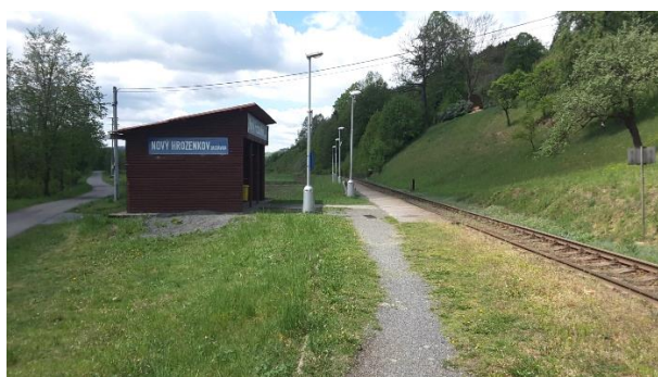
Pohled na nástupiště zastávky Nový Hrozenkov zastávka směřem ke Vsetínu.