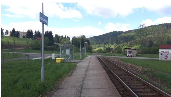
Pohled na nástupiště zastávky směrem ke Vsetínu.