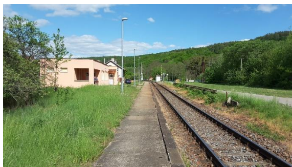
Pohled na nástupiště zastávky směrem k Bylnici.