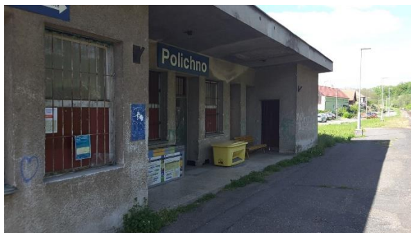
Pohled na objekt zastávky.