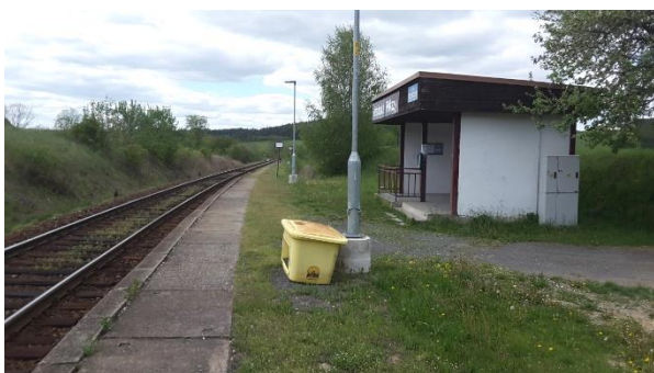
Pohled na nástupiště zastávky Valašské Příkazy směrem k Bylnici.