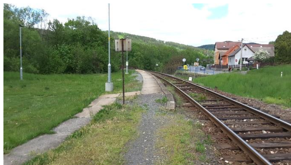
Pohled na nástupiště zastávky Návojná směrem k Horní Lidči. Vpravo u domu přístřešek autobusové zastávky