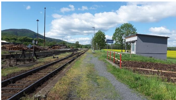
Pohled na nástupiště směrem ke Kojetínu.