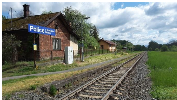
Pohled na nástupiště zastávky směrem k Valašskému Meziříčí.