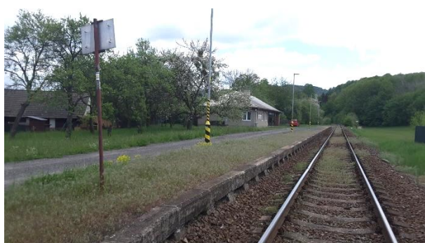
Pohled na nástupiště zastávky Huslenky zastávka směrem na Velké Karlovice.