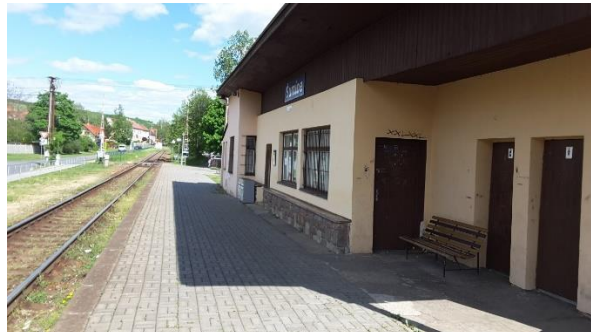
Pohled na objekt zastávky.