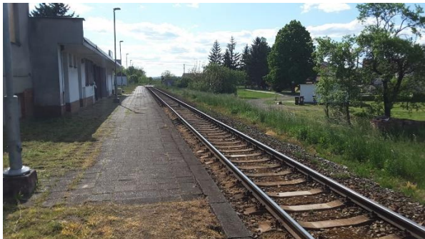
Pohled na nástupiště směrem ke Kunovicím.