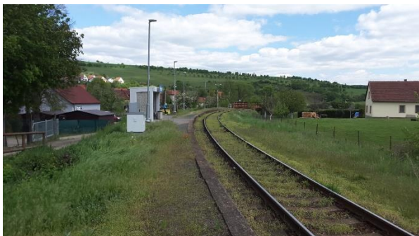
Pohled na nástupiště zastávky směrem k Bylnici.