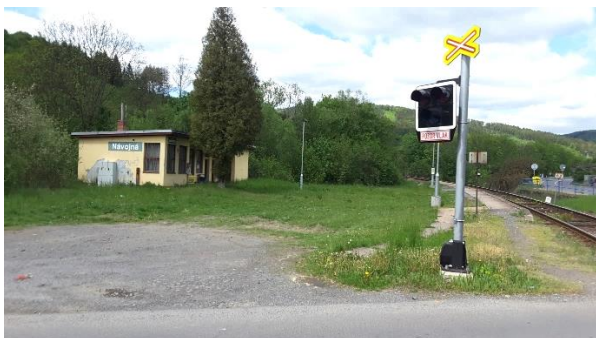
Pohled na zastávku Návojná od přejezdu silnice III/50736.