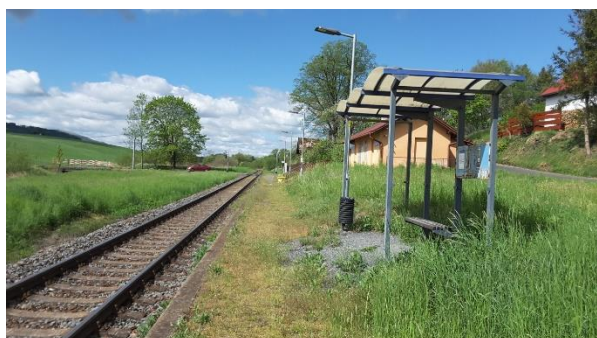
Pohled na nástupiště zastávky směrem ke Kojetínu se zdevastovaným přístřeškem.