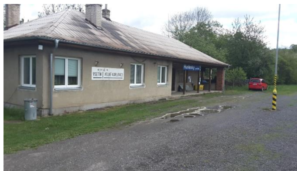
Pohled na objekt zastávky Huslenky zastávka.