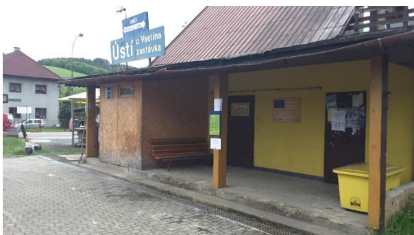
Pohled na objekt zastávky Ústí u Vsetína