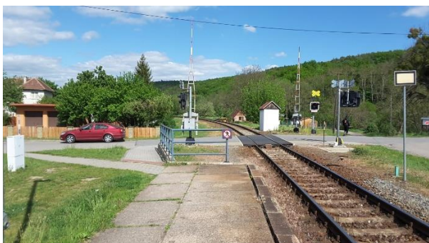
Pohled na přejezd místní komunikace s pěším přístupem k zastávce.