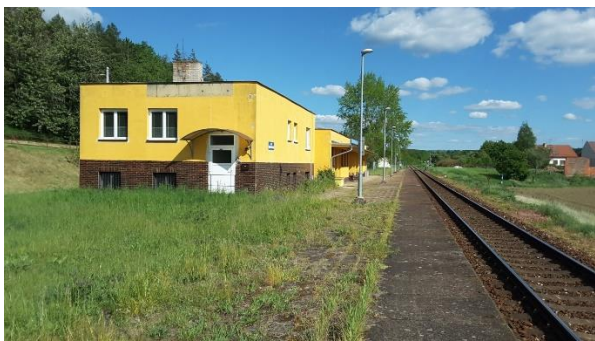
Pohled na nástupiště směrem k Bylnici.