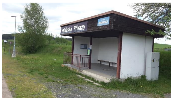
Pohled na přístřešek zastávky Valašské Příkazy.