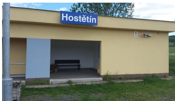
Pohled na přístřešek zastávky.