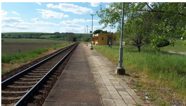
Pohled od přejezdu silnice III/05016 na nástupiště zastávky směrem ke Kunovicím.