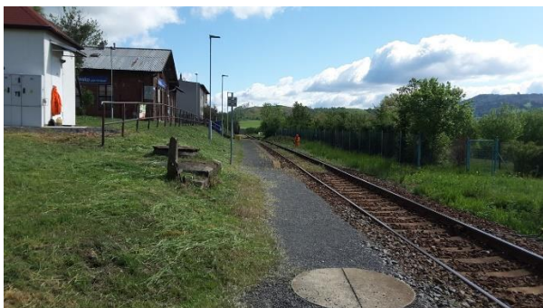
Pohled na nástupiště od přejezdu silnice III/43816 směrem k Valašskému Meziříčí. Vlevo původní objekt zastávky.