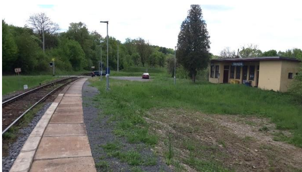
Pohled na nástupiště zastávky Návojná směrem k Bylnici.