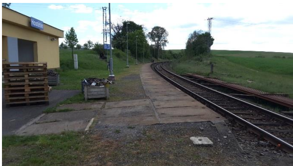
Pohled na nástupiště zastávky směrem ke Kunovicím.