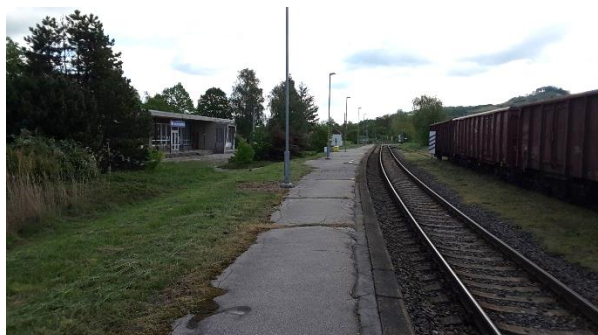
Pohled na nástupiště zastávky směrem k Valašskému Meziříčí.