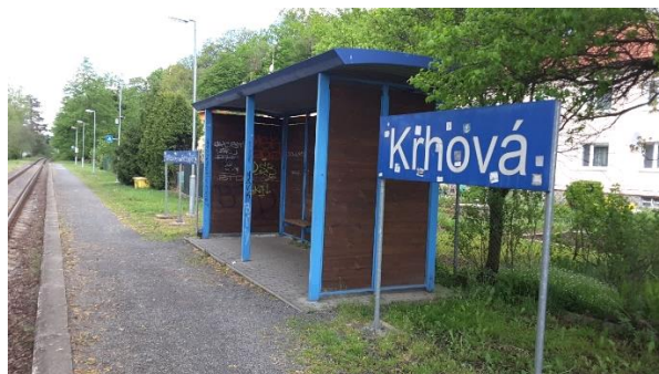
Pohled na zastávkový přístřešek a informační tabuli s názvem zastávky