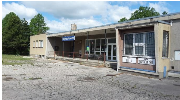
Pohled na objekt zastávky.