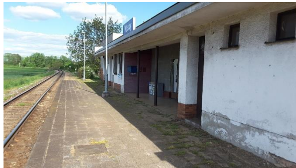
Pohled na objekt zastávky Vésky.