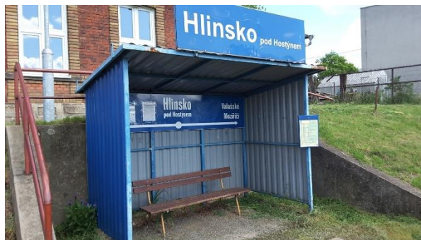
Pohled na přístřešek zastávky.