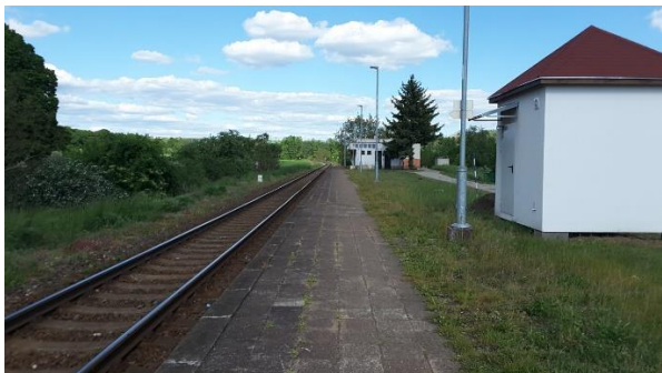
Pohled od přejezdu silnice III/05014 na nástupiště zastávky směrem k Bylnici.