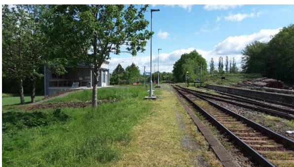
Pohled na nástupiště zastávky směrem k Valašskému Meziříčí