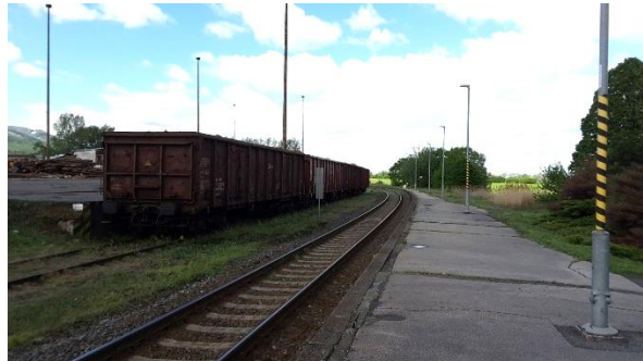
Pohled na nástupiště zastávky směrem ke Kojetínu.