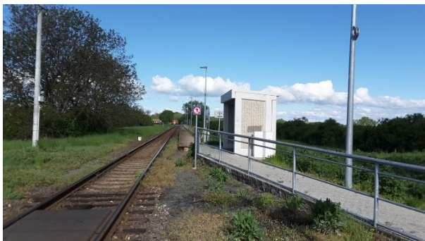
Pohled na nástupiště směrem ke Kojetínu.