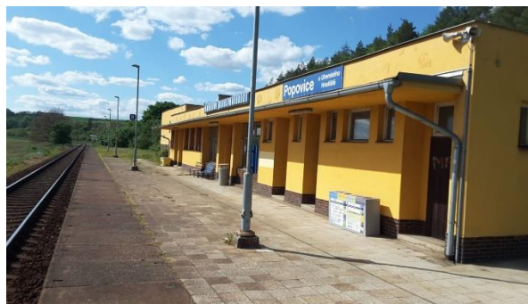
Pohled na objekt zastávky.