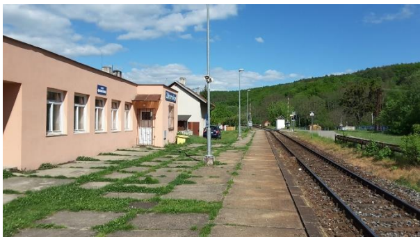
Pohled na objekt zastávky.