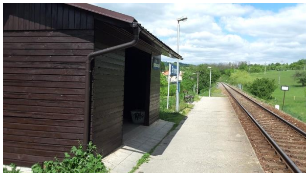
Pohled na zastávkový přístřešek zastávky Brumov střed.