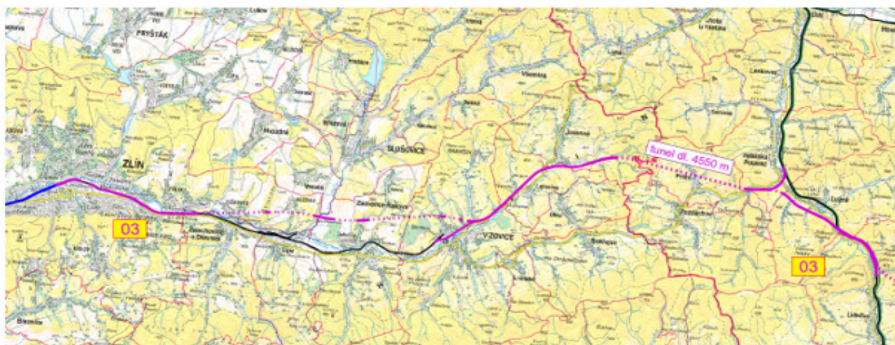
O3 Zlín (mimo) – Valašský kříž (modernizace / novostavba trati)