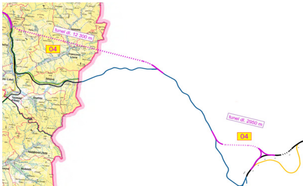
O4 Valašský kříž – Nosice (novostavba trati)