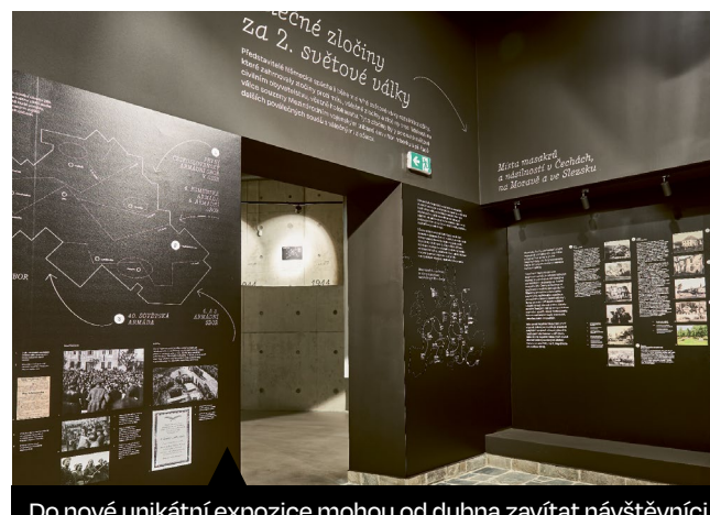
Do nové unikátní expozice mohou od dubna zavítat návštěvníci Národního kulturního památníku na Ploštíně. Připomíná osud zdejší pasekářské osady, kde nacisté na sklonku druhé světové války povraždili 24 pasekářů a do základů ji vypálili.