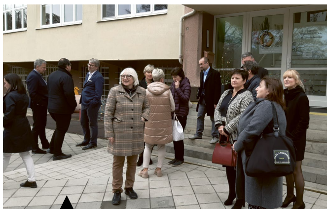
Společné setkání představenstev nemocnic Zlínského kraje, zástupců jejich dětských oddělení a Sdružení praktických lékařů pro děti a dorost uspořádal v Luhačovicích Zlínský kraj ve spolupráci s Lázněmi Luhačovice. Cílem setkání bylo seznámit jeho účastníky s dětskými léčebnami a možnostmi lázeňské léčby dětí.