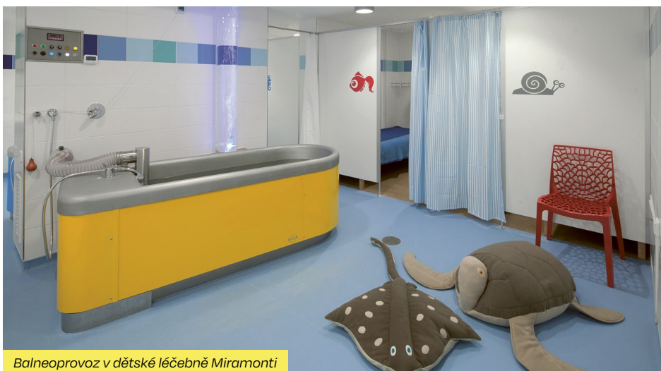
Balneoprovoz v dětské léčebně Miramonti

Nedávno si u nás léčený čtrnáctiletý chlapec nasadil večer na prst ruky svůj ocelový prstýnek. Ráno pak byl prst oteklý, zarudlý, silně bolel a prstýnek nešel sundat. Chlapce od prstýnku osvobodili až hasiči přivolaní na traumatologickou ambulanci krajské nemocnice ve Zlíně. I když se všechno nakonec obešlo bez poranění prstu, chlapec na tuto událost bude jistě dlouho vzpomínat. ■