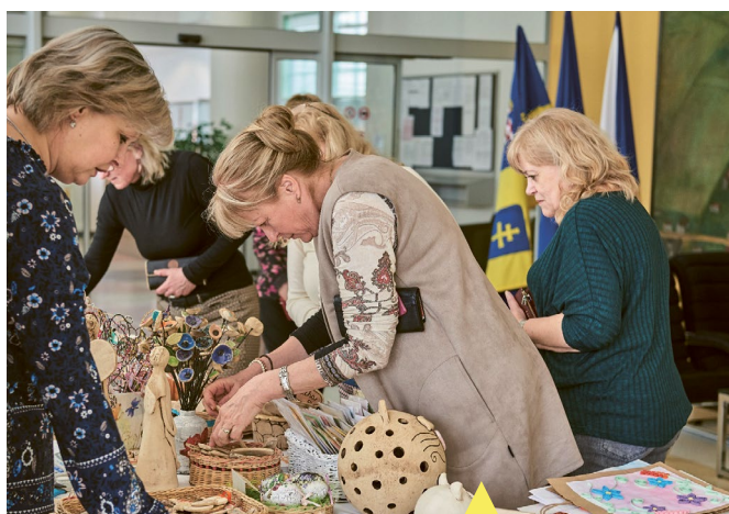
V sídle Zlínského kraje se uskutečnil Dobročinný velikonoční jarmark. Svě výrobky na něm nabízely organizace sociálních služeb a sociální podniky. Výtěžek využijí pro potřeby svých klientů.