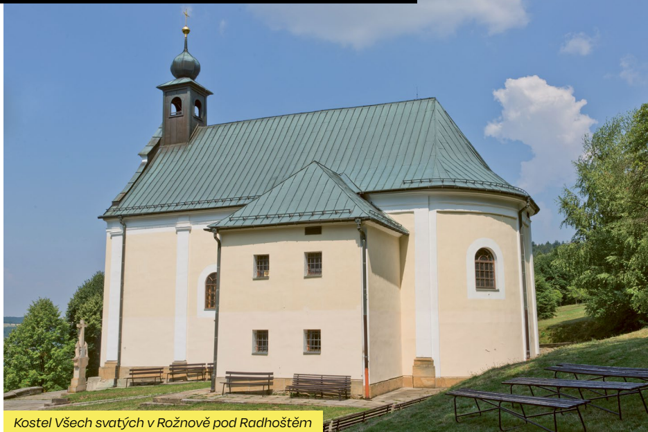
Kostel Všech svatých v Rožnově pod Radhoštěm

„Otevřené brány představují úspěšný projekt, který si získal oblibu veřejnosti a patří už k nedílné součásti kulturního dědictví a zajímavým turistickým cílům Zlínského kraje. Kostely zařazené do projektu poskytují příležitost poznat jejich architektonické i duchovní bohatství i jedinečné příběhy svědčící o bohaté historii. Za Otevřenými branami