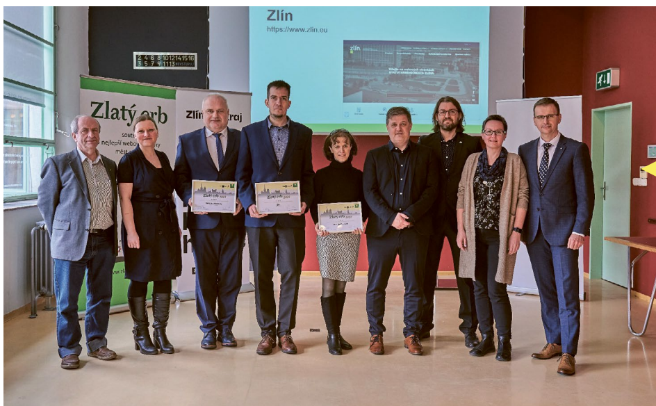
Ocenění zástupcům obcí s rozšířenou působností, které letos uspěly v krajském kole soutěže Zlatý erb o nejlepší webové stránky, byla předána na krajském úřadě ve Zlíně. Z vítězství se raduje Zlín, na druhé příčce skončilo Uherské Hradiště, třetí místo obsadily Valašské Klobouky.