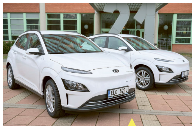
Dva nové elektromobily Hyundai budou sloužit v domovech pro osoby se zdravotním postižením ve Valašském Meziříčí a Zašově, a to například k přepravě klientů nebo k dovozu obědů a nákupů. Jde o vůbec první dva elektromobily, které Zlínský kraj pořídil, nákup dalších šesti desítek plánuje.