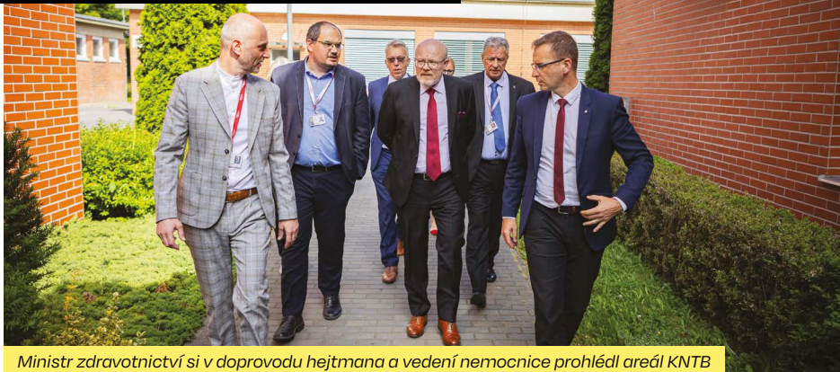
Ministr zdravotnictví si v doprovodu hejtmana a vedení nemocnice prohlédl areál KNTB

Dalším tématem byla spolupráce s Univerzitou Tomáše Bati ve Zlíně zaměřená na vzdělávání potřebného odborného personálu, bez něhož se nemocnice v budoucnu neobejde.