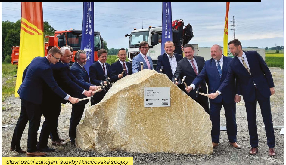
Slavnostní zahájení stavby Palačovské spojky

Palačovská spojka je důležitou součástí budoucího dopravního připojení Valašska na dálnici D48 a navazující dálnici D1 Praha – Brno