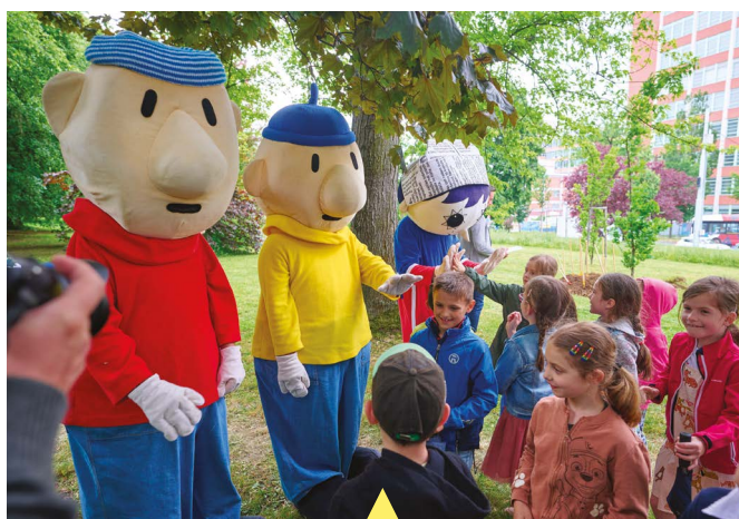
Mezinárodní festival filmů pro děti a mládež hostil začátkem června už tradičně Zlín. Během jeho letošního ročníku mohli diváci mimo jiné zhlédnout i tři snímky natočené ve Zlínském kraji a s jeho podporou – drama Erhart, seriál Sex O'clock a animák Tonda, Slávka a kouzelné světlo.