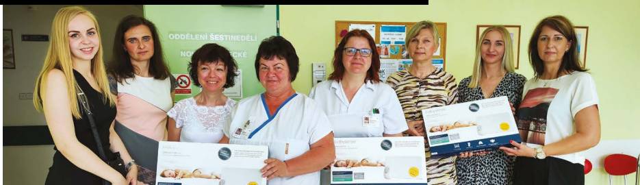
Monitory dechu převzala primářka Dětského oddělení od Nadace Křížovatka za účasti zástupců sponzorů

„Nadace podporuje naše oddělení dlouhodobě. My si této spolupráce velmi vážíme a děkujeme za ni. Narozená miminka jsou do prvního půl roku velmi zranitelná. Monitory dechu pomáhají předcházet zdravotním potížím, jsou skvělými pomocníky v dobách silných respiračních onemocnění a snižují riziko syndromu náhlého úmrtí kojence,“