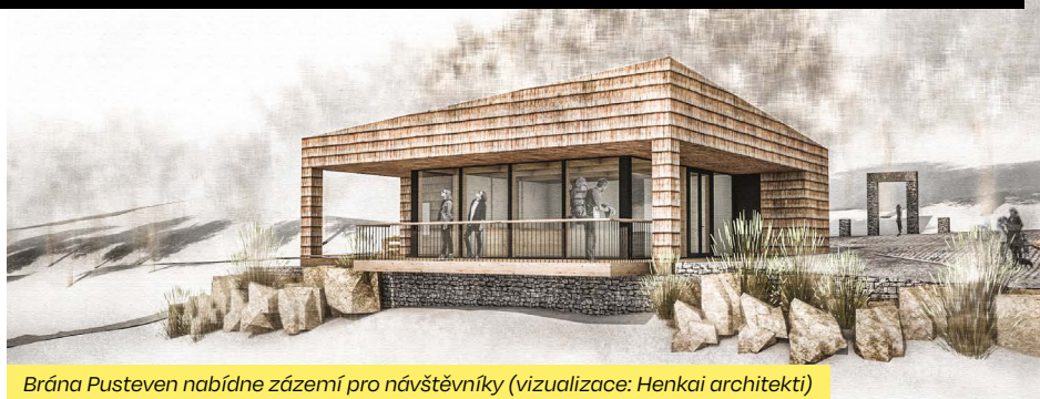
Brána Pusteven nabídne zázemí pro návštěvníky (vizualizace: Henkai architekti)

„Pustevny jsou atraktivním spojením nádherné beskydské přírody a unikátní Jurkovičovy architektury. To jsou hodnoty, o které musíme pečovat. Návštěvníci si zaslouží důstojné a kvalitní zázemí, díky kterému budou moci zahodit starosti a stres všedních dní. Přesně to je smyslem projektu Brána Pusteven,“ říká náměstek hejtmána pro cestovní ruch Lubomír Traub.