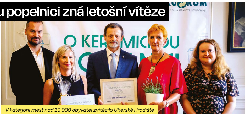
V kategorii měst nad 15 000 obyvatel zvítězilo Uherské Hradiště