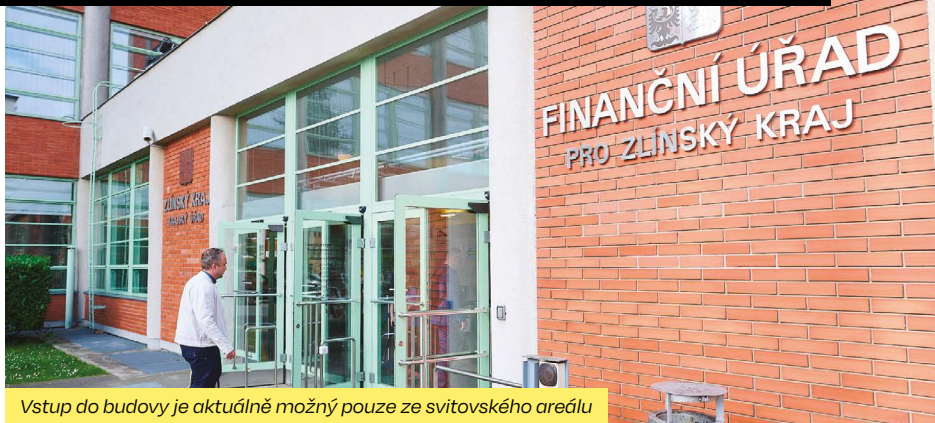
Vstup do budovy je aktuálně možný pouze ze svitovského areálu

Opravy se dočkají břízlolitové omítky, poškozené cihelné pásy nahradí nové. Dále se počítá s obnovou hydroizolace a oplechováním střech. Oprava čeká také konstrukci pojízdné lávky, takzvané kočky, využívané k mytí oken. „V průběhu roku vyroste postupně kolem celé budovy, která má rozměry 80 krát