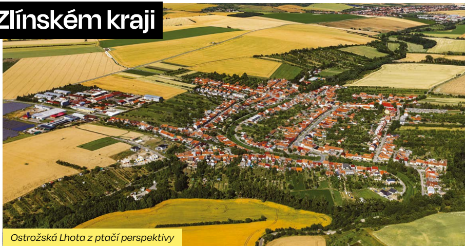
Ostrožská Lhota z ptačí perspektivy

Vítězem letošního krajského kola soutěže Vesnice roku se stala Ostrožská Lhota. Postupuje tak do kola celostátního. V něm je Zlínský kraj co do počtu vítězných obcí vůbec nejúspěšnějším krajem ze všech.