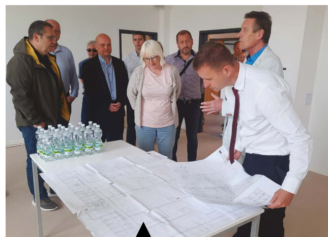
Aktuálně dokončované investiční akce ve zdravotnictví si prohlédli představitelé Zlínského kraje. Ve Vsetínské nemocnici bude už o prázdninách zprovozněno nové hemodialyzační středisko a na podzim magnetická rezonance, v říjnu pak v Otrokovcích nová výjezdová základna zdravotnických záchranářů.