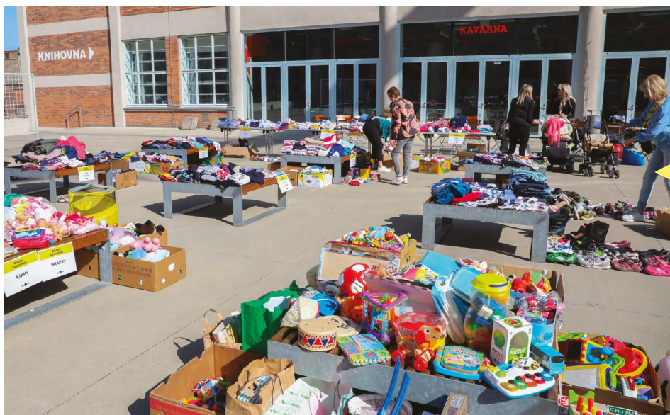
Pomáhat zejména samoživitelkám a sociálně slabším rodinám je smyslem akce Zlínský Zdar-máček, kterou už potřetí uspořádali zaměstnanci Krajského úřadu Zlínského kraje. Zájemci si sem mohli přijít vybrat z množství zánovního i nového oblečení a obuvi pro děti i dospělé, dětského vybavení, hraček, školních potřeb, knih a jiných věcí.