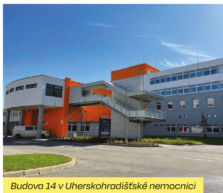
Budova 14 v Uherskohradištské nemocnici

Cenu hejtmána Zlínského kraje dostala rekonstrukce objektu 14 (plicního pavilonu) v Uherskohradištské nemocnici. „Zvládnout rekonstrukci zdravotnického zařízení za provozu je velmi komplikované. Současně je to příkladná ukáзка toho, že i ve zdravotnictví se dají modernizovat původní budovy, které díky tomu mohou nadále sloužit další desítky let,“ uvedl hejtmán Radim Holíš a dodal: „I když Cena hejtmána je jen jedna, chtěl bych vyzdvihnout všechny stavby, které se letošního ročníku soutěže zúčastnily. Je za nimi vidět velký kus práce, úsilí, pečlivosti i invence. Děkuji všem investořům i stavařům, kteří se o jejich vznik zasloužili.“