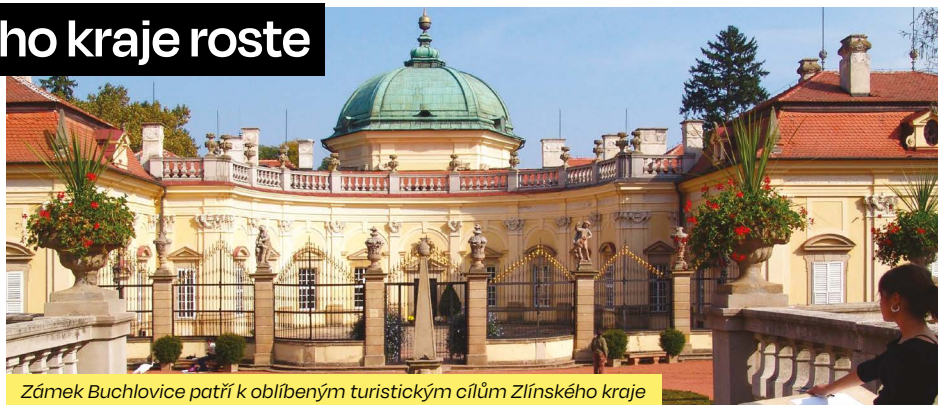
Zámek Buchlovice patří k oblíbeným turistickým cílům Zlínského kraje

„Největší radost máme z nárůstu návštěv ze zahraničí. Je jich o celých 65 % více než ve stejném období před rokem, současně je nutné říci, že je pro nás enormně důležitá přítomnost i spokojenost návštěvníků domácích,“ komentuje výsledky náměstek hejtmána Zlínského kraje Lubomír Traub a dodává: „Turistických cílů v našem kraji neustále přibývá, také úroveň služeb roste, a to díky