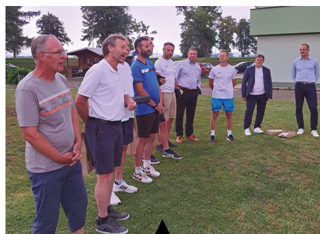
Přátelské tenisové utkání tří krajů ze tří zemí uspořádala v Uherském Hradišti a Starém Městě Krajská tenisová akademie Zlínského kraje. Zúčastnila se jej téměř stovka mladých tenistů z regionu, Západoslovenského kraje a maďarského kraje Győr. Navštívil jej i Miloslav Mečíř, olympijský vítěz v tenise ze Soulu a předseda Slovenského tenisového svazu (druhý zleva).