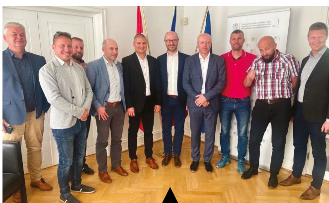
Výměna zkušeností v oblasti dopravy a dopravních inovací byla cílem zahraniční pracovní cesty do Norska, které se ve dnech 12. až 16. června zúčastnila delegace složená ze zástupců Zlínského kraje, Statutárního města Zlína, Ředitelství silnic Zlínského kraje, Koordinátora veřejné dopravy Zlínského kraje a dalších specialistů na dopravu.