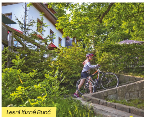
Lesní lázně Bunč