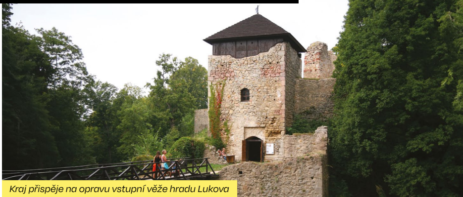
Kraj přispěje na opravu vstupní věže hradu Lukova

„Z našeho dotačního programu na podporu stavební obnovy a restaurování kulturních památek a památek místního významu podpoříme 43 projektů celkovou částkou 8,5 milionu korun. Díky tomu se opravy dočkají například kostely ve Vidči, Bojkovicích, Tlumačově, Mysločovicích, Ratajích, Francově Lhotě nebo Velkém Ořešově,“ přiblížila radní Zlínského kraje pro kulturu Zuzana Fišerová. Mezi památkami, jichž se budou opravy a restaurátorské práce týkat, jsou dále i radnice v Kelči, zámky v Luhačovicích, Lešné či Zdounekách, zřícenina