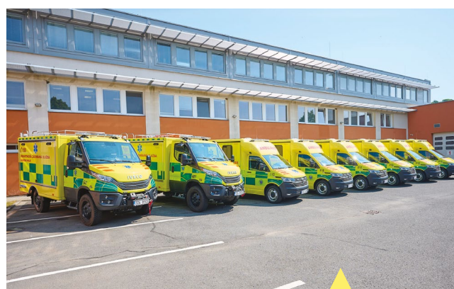
Šest nových mobilních jednotek intenzivní péče a dvě vozidla pro mimořádné události jsou nově součástí vozového parku Zdravotnické záchrané služby Zlínského kraje. Sanitky přišly na víc než 21 milionů korun a vozidla pro mimořádné události na 10,5 milionu korun. Na tuto investici se podařilo získat 100 % státní dotace.