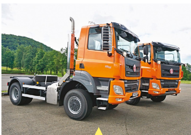
Dva nové automobily Tatra převzali na kopřivnickém polygону zástupci společnosti Správa a údržba silnic Slovácka. Z dílů dodaných automobilkou TATRA TRUCKS je v rámci unikátního projektu „Tatra do škol“ sestavili učni oboru automechanik ze Středního odborného učiliště Valašské Klobouky a Střední průmyslové školy Otrokovice.