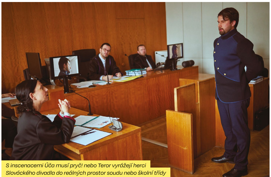
S inscenacemi Úča musí pryč! nebo Teror vyrazí herci Slováckého divadla do reálných prostor soudu nebo školní třídy