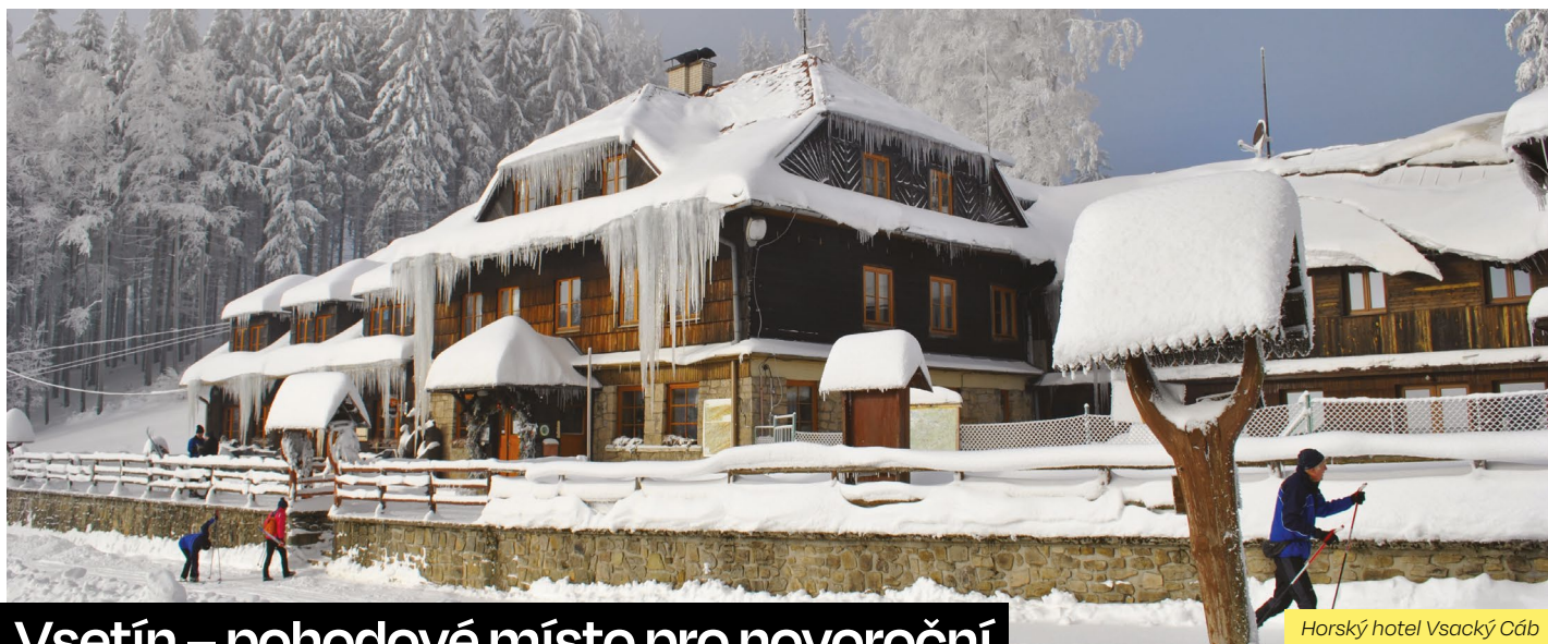
Horský hotel Vsacký Cáb