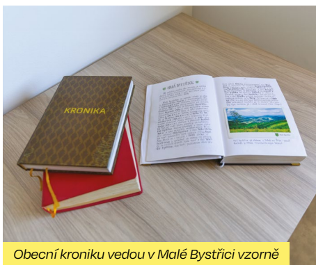
Obecní kroniku vedou v Malé Bystřici vzorně

Turisté mohou ze Santova vyrazit na krásnou hřebenovku vedoucí po okraji katastru obce přes jezero na Sedle, Vsacký Cáb až na Dušnou. Tuto cestu si lze zpříjemnit mléčným karamellem, který se na Santově vyrábí. Ale je nutné dodat, že se jedná o silně návykovou dobrotu. Návštěvníci by neměli minout ani Svantovítovu skálu na dalším z vrcholků. Ta je nyní po 70 letech celá vidět i dole z obce, a to živem kůrovcové kalamity.