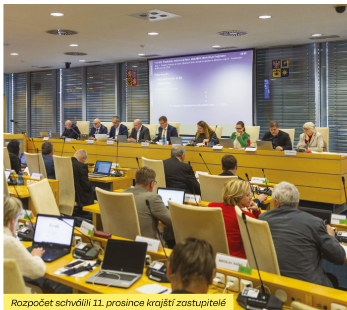
Rozpočet schválili 11. prosince krajsí zastupitelé

Rozpočtované výdaje ve výši 22,029 miliard korun jsou tvořeny běžnými (84,24 %) a kapitálovými výdaji (15,76 %). Součástí běžných výdajů jsou výdaje související s trans-