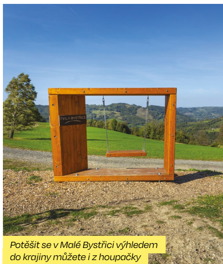
Potěšit se v Malé Bystřici výhledem do krajiny můžete i z houpačky

Malá Bystřice je podhorská obec, kterou najdete uprostřed Vsetínských vrchů jižně od přehrady Bystřička. V malebné valašské krajině se střídají lesy, horské pastviny, chalupy a chatové osady rozestě po stráních a údolích. Zdejší vrcholky nabízejí nevšední výhledy do okolních scenérií plných zeleně. Ne nadarmo si obec říká „dědina sta kopců“. První písemná zpráva o ní pochází z roku 1620, z doby, kdy vznikala z rozptýlených pasekářských usedlostí zakládaných poddanými z rožnovského panství. V životě obce hrají velmi důležitou roli spolky. V první řadě jsou to dobrovolní hasiči, jejichž sbor letos oslaví 40. výročí. Pravidelně pořádají oblíbený ples, před několika lety se pustili do budování vodní nádrže a vyletiště, které hojně využívají další spolky. V Malé Bystřici působí také myslivci či sportovci, nejoblíbenější je zde samozřejmě fotbal.