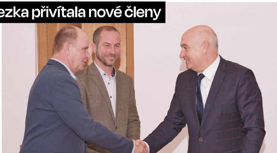
Starosta Modré Miroslav Kovářik, starosta Velehradu Aleš Mergental a náměstek hejtmána Lubomír Traub

„Velmi mě těší, že v roce 2023, kdy si slovanské země připomínají 1160 let od příchodu Konstantina-Cyrila a Metoděje na Velkou Moravu a 10 let činnosti našeho sdružení,