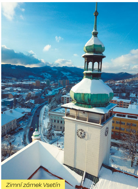
Zimní zámek Vsetín

Pro milovníky historie a kultury je zámek Vsetín skvělou volbou. Pro návštěvníky je otevřena cesta do minulosti, která vás zavede skrze stále expozice až k vrcholu zámecké věže. Z šedesáti metrů vysoké věže se vám naskytne panoramatický výhled, který je v každém ročním období dechberoucí.