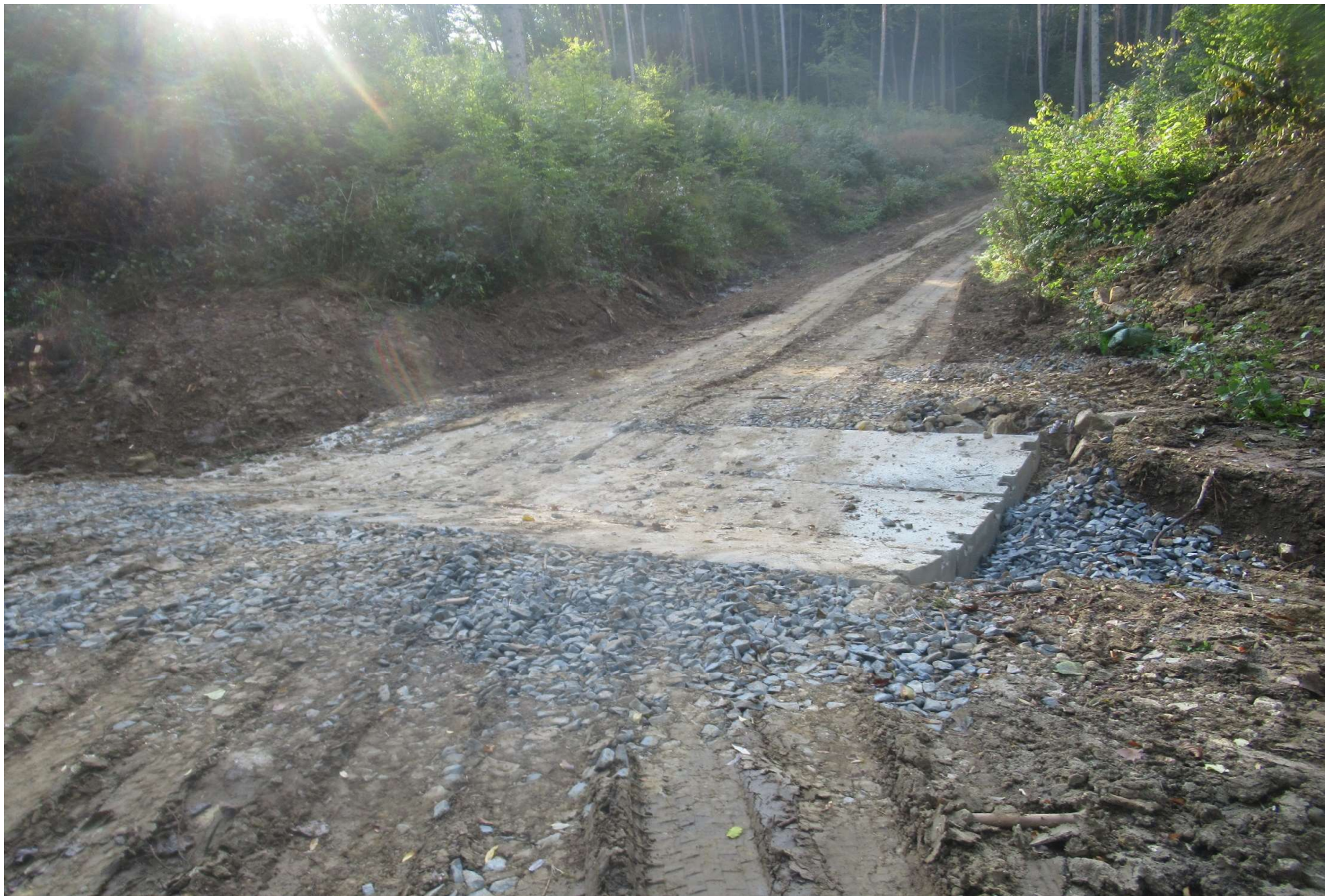
Panelový průleh zdvojený