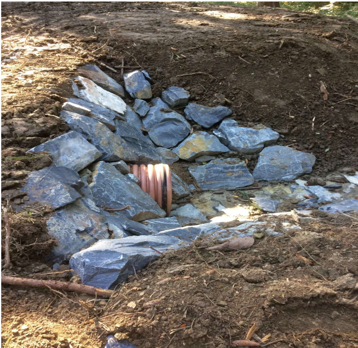
Vzorová výpust' příčného objektu - propustku