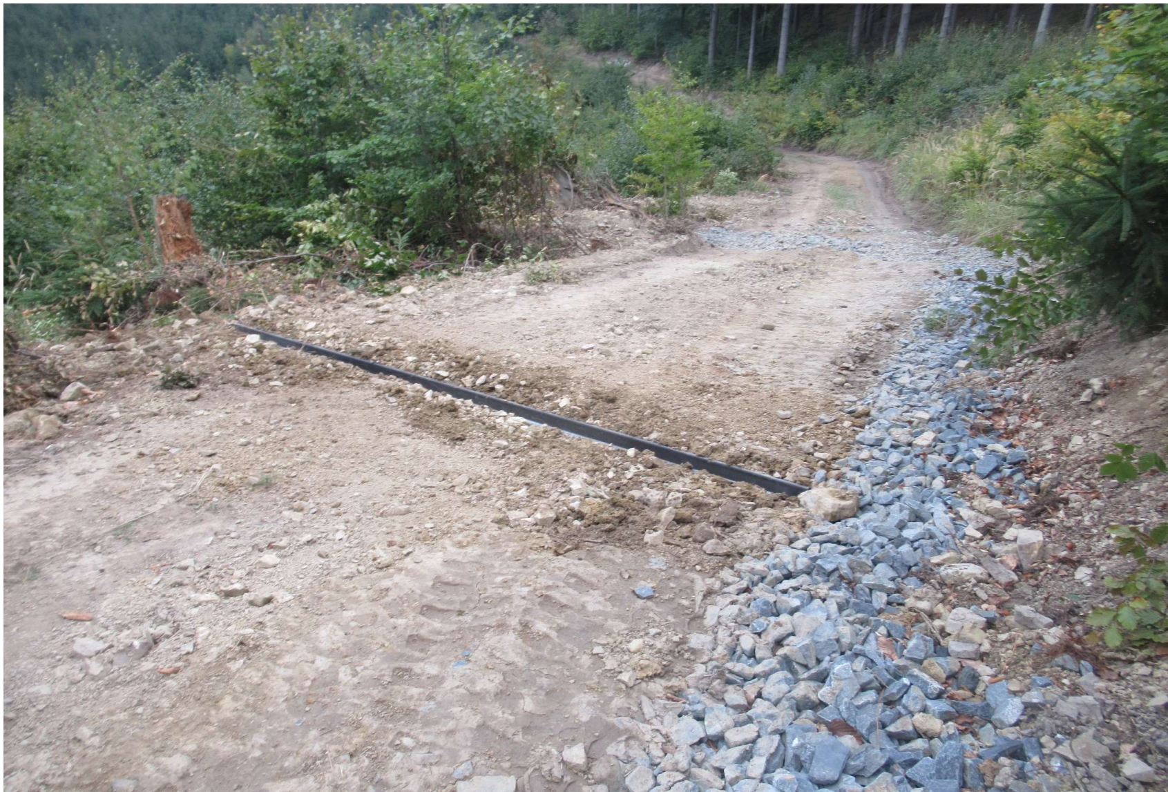
Kombinace ocel. svodnice s drenáží