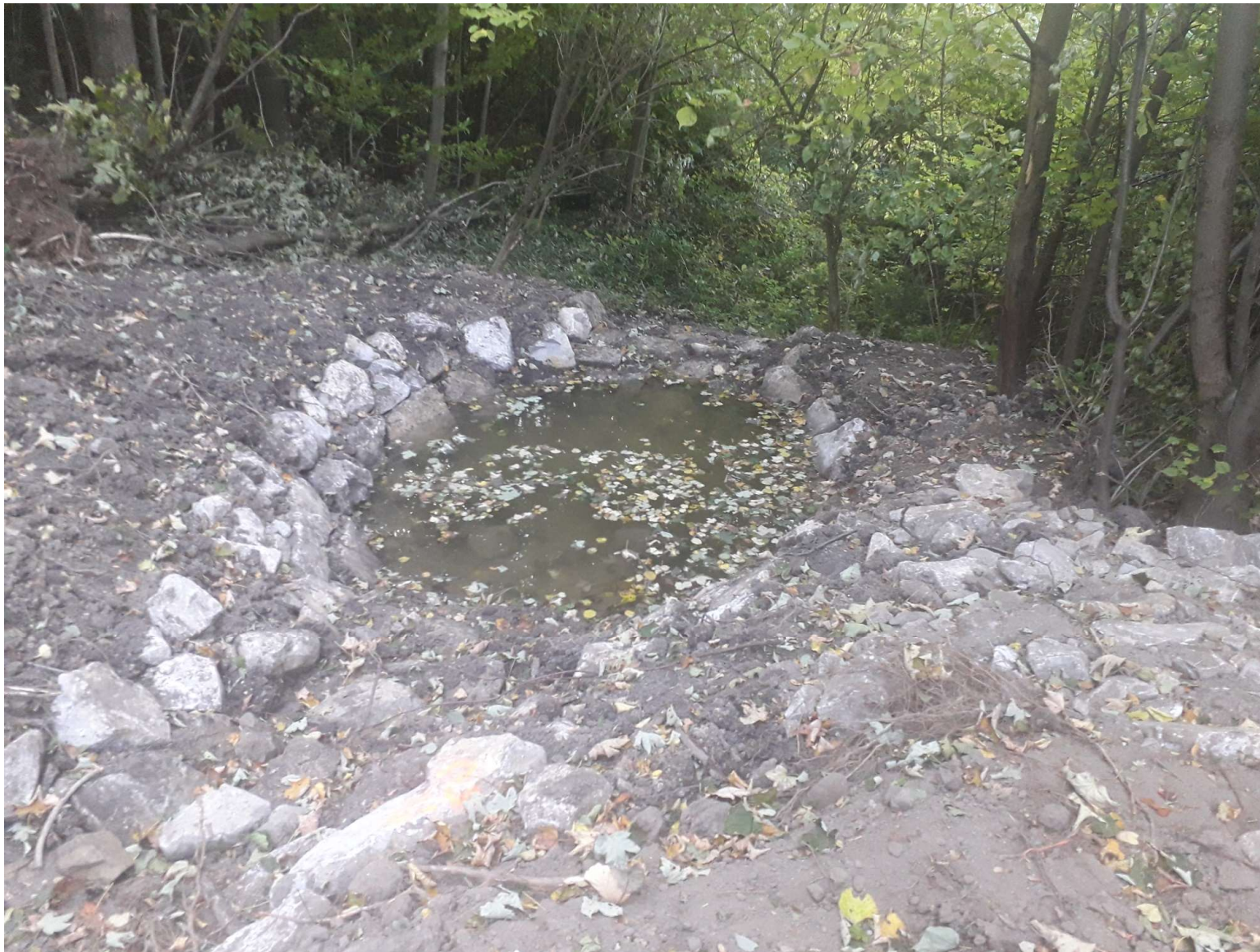
vsakovací objekt – retenční nádržka