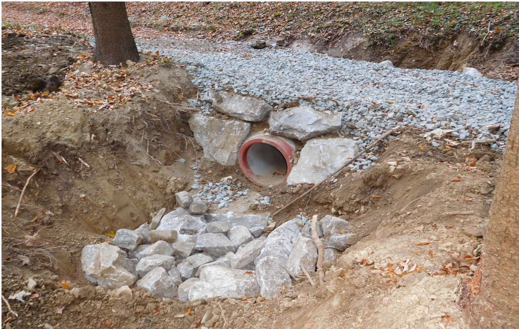
Vzorová výpust' příčného objektu - propustku