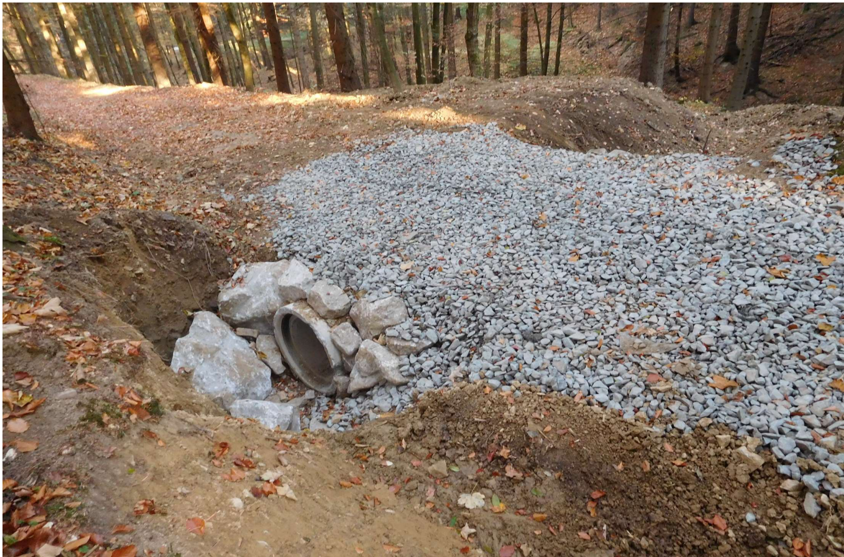
Částečné opevnění vpusti příčného objektu - propustku