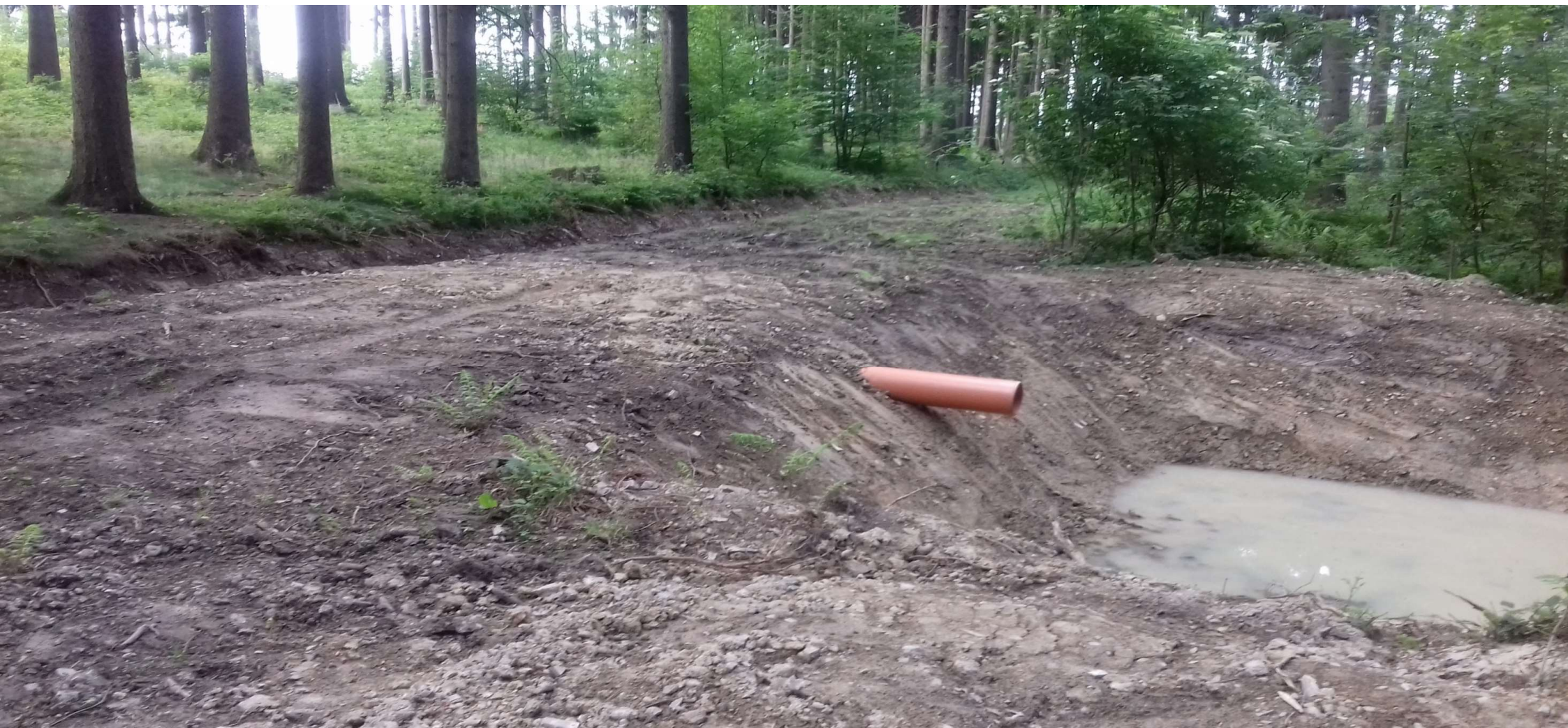
Detail vsakovacího objektu (protipožární nádržky)