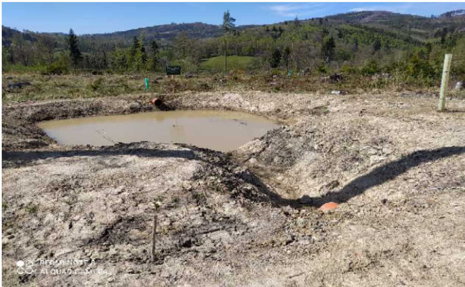
Detail vsakovacího objektu (protipožární nádržky)