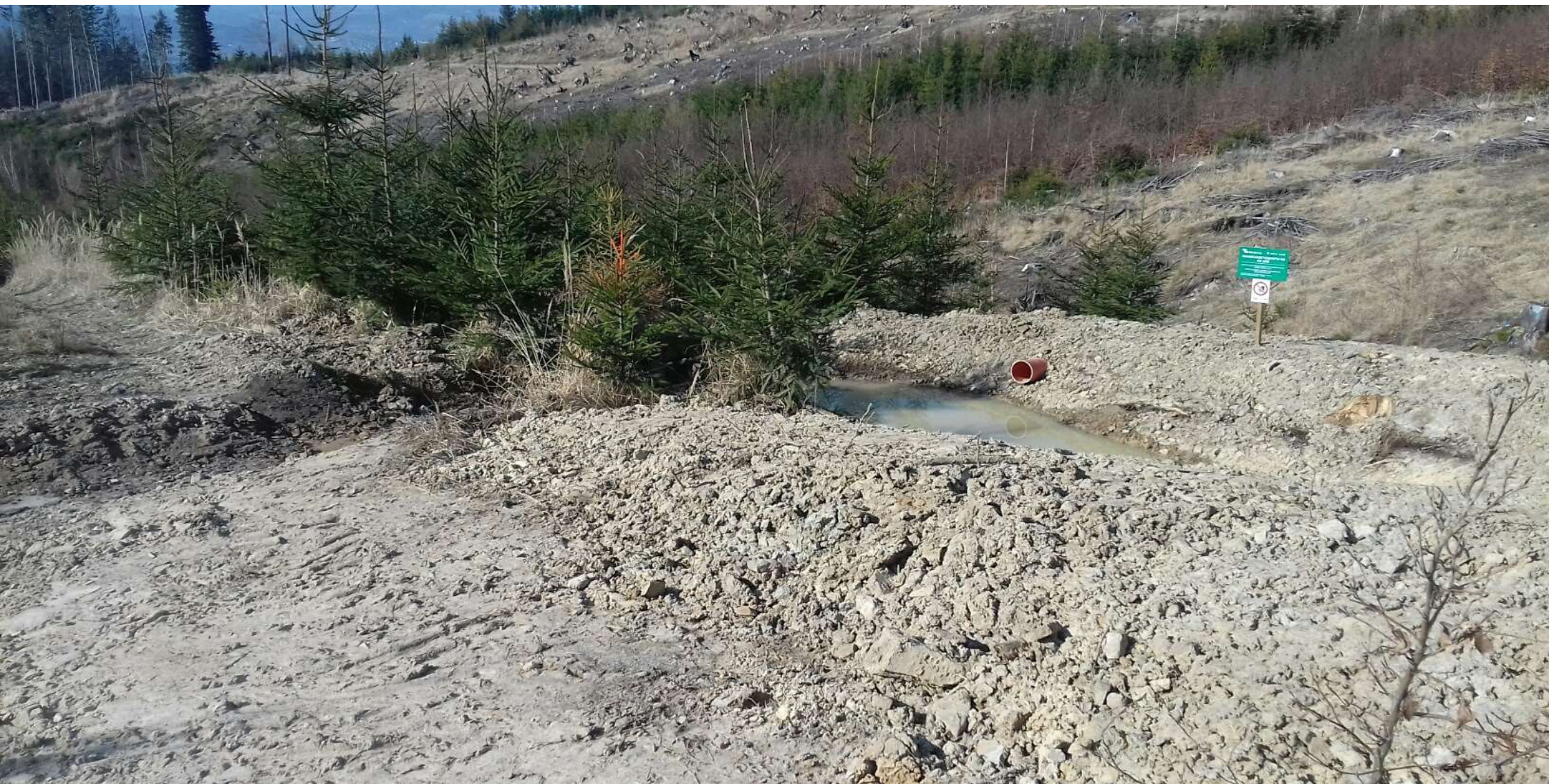
Detail vsakovacího objektu (protipožární nádržky)