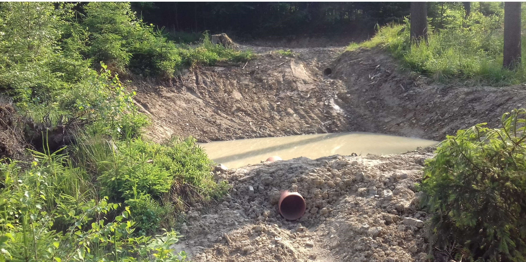
Detail vsakovacího objektu (protipožární nádržky)