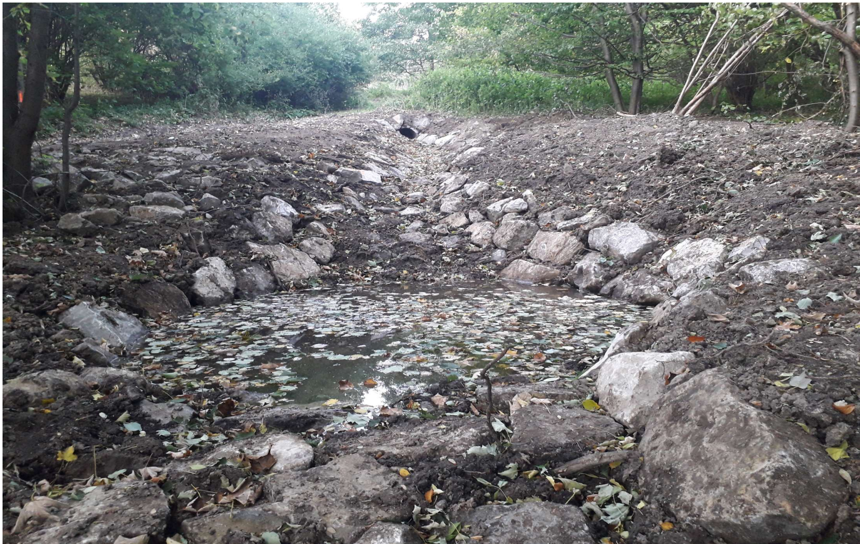
vyústění propustku s retenční nádržkou