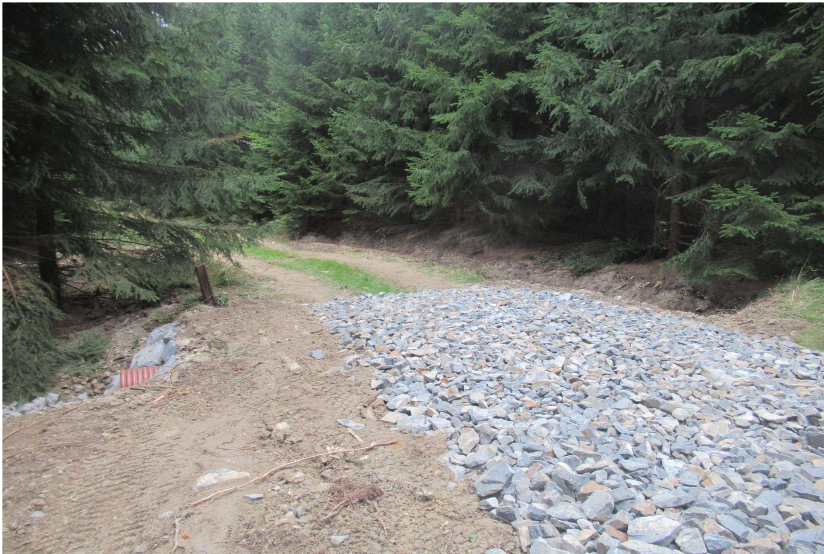
Propustek s úpravou zářezového svahu