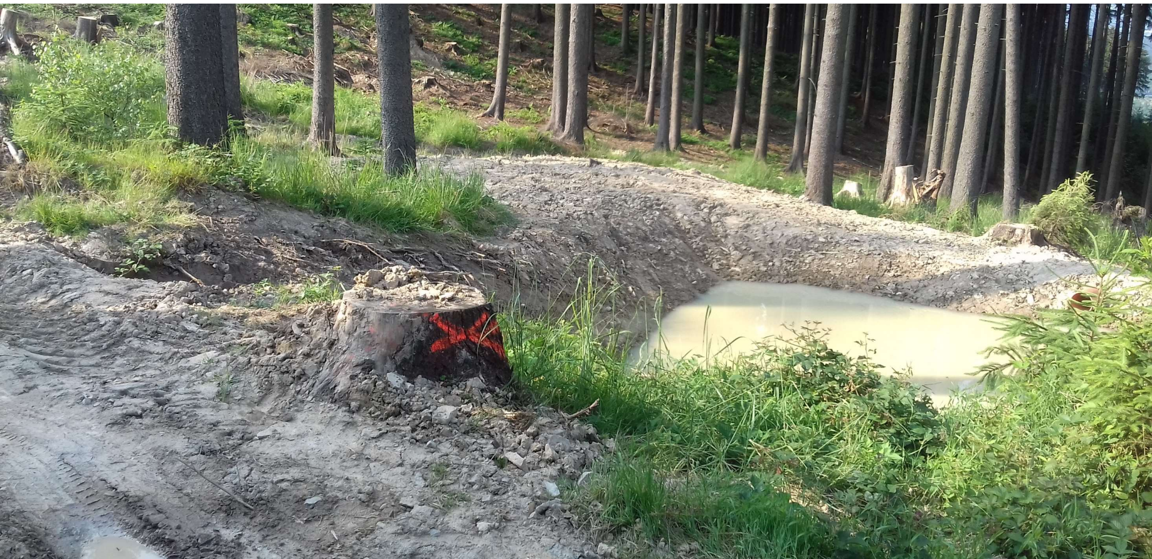
Detail vsakovacího objektu (protipožární nádržky)