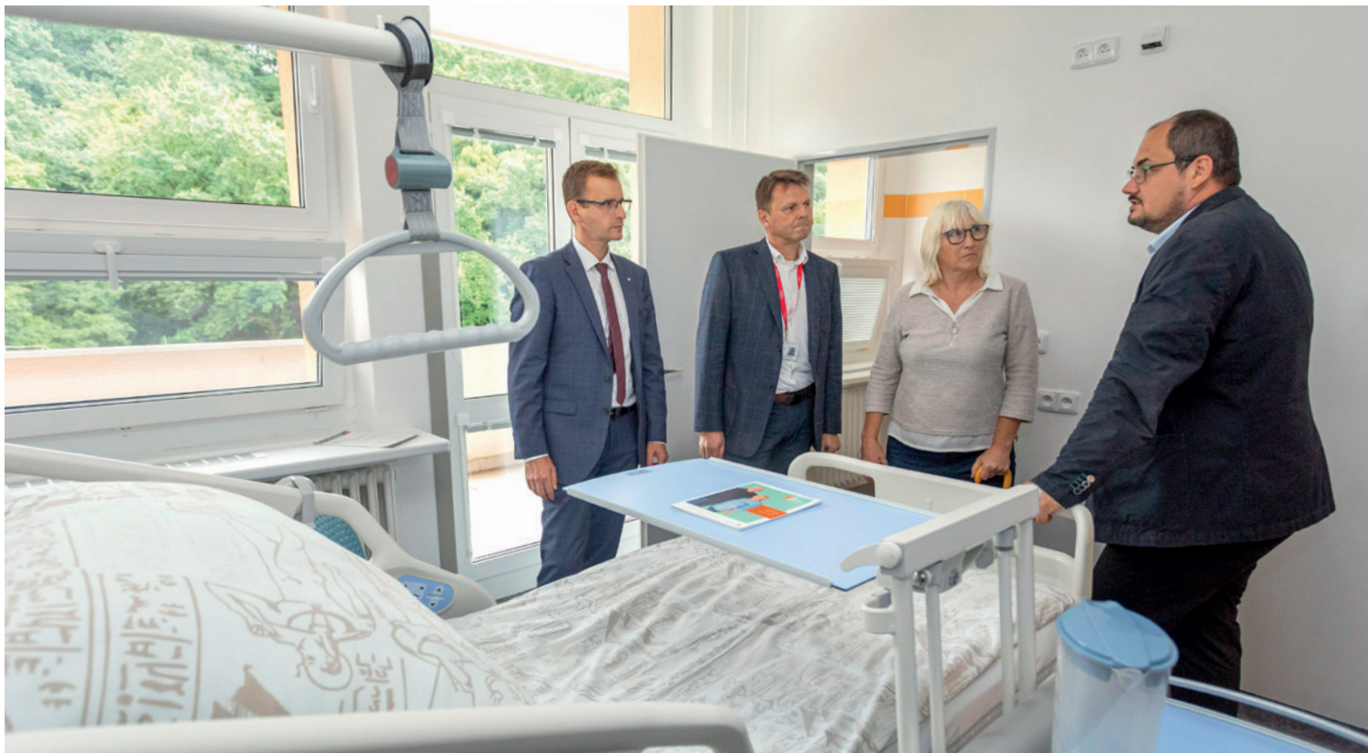
↑ NA PROHLÍDCE. Při loňském otevření nových pokojů na chirurgickém oddělení v Krajské nemocnici T. Bati ve Zlíně.