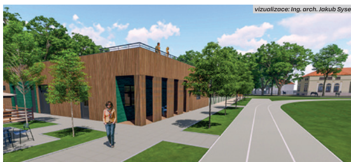
vizualizace: Ing. arch. Jakub Sysel

Pionýrská louka v Kroměříži, nacházející se v bezprostřední blízkosti Podzámecké zahrady, se po letech dočká obnovy. Hejtmánství tu plánuje vybudovat nové moderní sportoviště i budovu zázemí. Využívat je budou nejen krajem zřizovaná Střední škola hotelová a služeb Kroměříž a další školy, ale také sportovci a veřejnost.