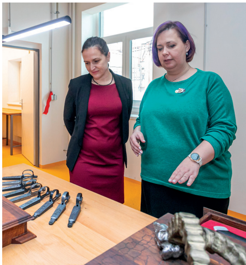
↑ V RYTECKÉ DÍLNĚ. Kraj investuje do svých škol. Příkladem je nově vybavená rytecká dílna Střední školy-COPT Uherský Brod.

Setkávám se jenom s pozitivními ohlasy. Nový objekt i expozice jsou vysoce hodnoceny jak z hlediska architektonického, tak expozičního. V celostátní soutěži Stavba roku byla Ploština oceněna za mimořádný celospolečenský přínos, formu představení a podobu ztvárnění expozice. Nový objekt je velmi citlivě zapuštěn do terénu a osobně