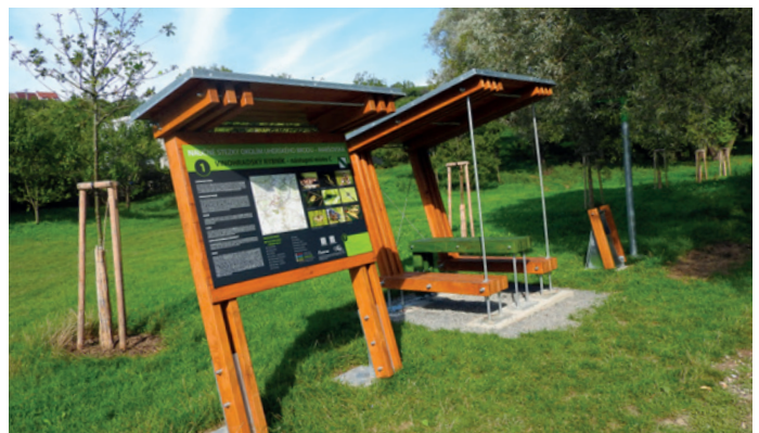
↓ Začátek Maršovské naučné stezky