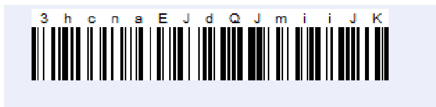
Obr. č. 5. - vzor

Rozpracovanou Závěrečnou zprávu si můžete uložit, stejně jako formulář žádosti, pomocí tlačítka „uložit data“. Uloží se vám soubor s příponou XML (nejčastěji do složky Stažené/Download). Při