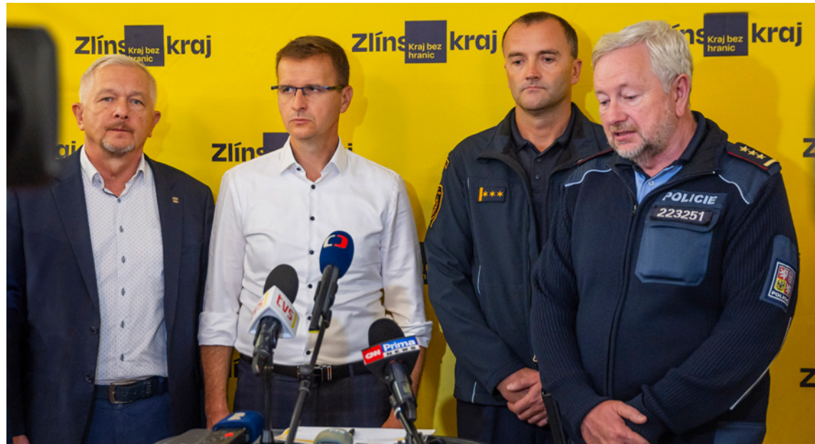
↑ BRÍFINK K POVODNÍM. Hejtmán zodpovídá také za krizové řízení. Během povodní, které v září zasáhly Zlínský kraj, na tiskových brífincích pravidelně informoval veřejnost o aktuální situaci.

Naše priority se nemění, zůstávají jimi zdravotnictví, doprava i téma stárnutí našeho kraje. Na tom jsme se jako ko-