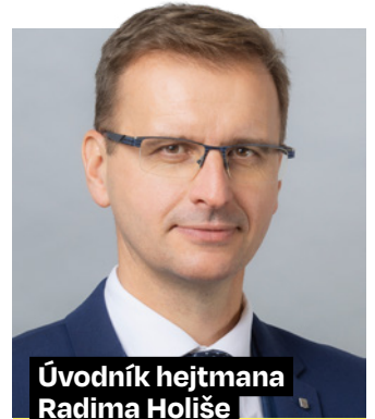
Úvodník hejtmána Radima Holíše

Výstavba vodárenské nádrže ve Vlachovicích je obrovský projekt, který má pro Zlínský kraj a jeho obyvatele zásadní význam. Díky ní budeme mít v této části regionu zajištěný spolehlivý zdroj pitné vody na dalších padesát let. Je to krok, kterým se připravujeme na dopady klimatických změn a stále častější nepředvídatelné rozměry počasí.