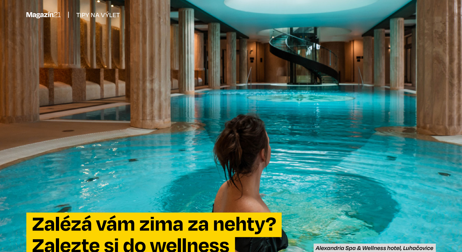
Alexandria Spa &amp; Wellness hotel, Luhačovice