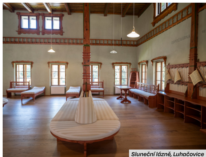
Sluneční lázně, Luhačovice

Tip: Návštěvu Luhačovic určitě spojte s prohlídkou nádherně renovovaných Slunečních lázní architekta Dušana Jurkoviče.