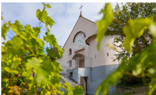
↑ VINAŘSKÁ HISTORIE. Viniční lány Ořechov obklopují, na vinnou révu ale narazíte i v centru.

To, že má Ořechov zemědělskou historii spatřou především v vinařství, poznáte také ze znaku obce. Stříbrný ořešák na něm vyrůstá ze zlaté hradby a nechybí ani zahnutý vinařský nůž kosíř. Hojně navštěvované jsou pak krojované Slovácké hody s právem o svátku sv. Václava i košť vín nezvykle pořádaný 26. prosince s pří-