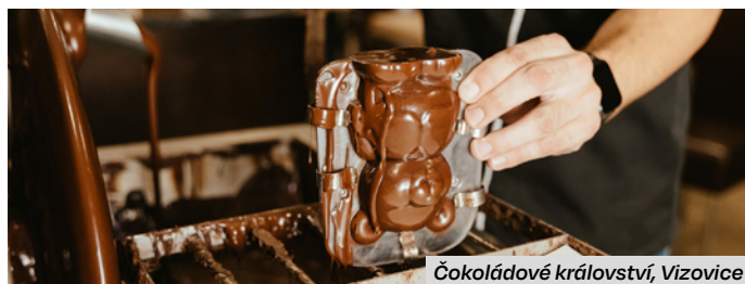
Čokoládové království, Vizovice

Luhačovice lákají na střešní vířivku římských lázní hotelu Alexandria, na wellness s otužováním i meditační jurtou v Augustiniánském domě, na odpočinek s výhledem do krajiny v hotelu Vega, relaxační klub s atmosférou první republiky v hotelu Radun, na sudové sauny na břehu Luhačovické přehrady v Penzionu U Přehrady. Mrkněte taky na velkorysý wellness hotelů Pohoda a Ambra nebo lázeňské pobyty v hotelech Miramare nebo Lázně Luhačovice.