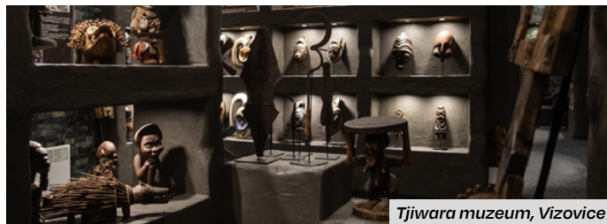
Tjiwara muzeum, Vizovice