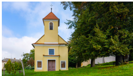
↑ CHRÁNĚNÁ PAMÁTKA. Kapli sv. Václava najdete v parku před zámkem, zároveň zde začíná křížová cesta.

První zmínka o Ořechově, který se rozprostírá v údolí stejnojmenného potoka, se datuje daleko do minulosti – až do roku 1141. I historie tamější dominanty, renesančního zámku stojícího na místě dřívější tvrze, je dlouhá. Zámek totiž pochází z konce 16. století. Zajímavostí je, že jedno z křídel zámku bylo později odděleno a přestavěno na římskokatolickou kapli. Taková kombinace světské a sakrální architektury je v regionu poměrně neobvyklá. V parku před zámkem se nachází památkově chráněná kaple sv. Václava se zvonicí, v jejímž prostoru je umístěna restaurovaná plastika sv. Nepomuckého z poloviny 18. století.