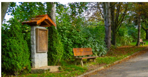
↑ KALVÁRIE. Křížová cesta vás zavede z centra obce k místnímu hřbitovu. Má čtrnáct zastavení.