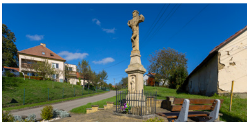
↑ PAMÁTKA. V obci se nachází šest křížků a jeden svatý obrázek.

Jak vypadaly tradice v regionu na konci 19. století? Co se tam zpívalo, jaké znaly děti hry a říkadla, jak znělo nářečí a vypadal dobový kroj? To vše prezentuje dětský soubor Doubravjánek, který v obci funguje od roku 2006. Vznikl na popud místních rodičů za podpory obecního úřadu, když Doubravy slavily 600 let od svého založení. Od té doby Doubravjánek, v němž účinkují takřka dvě desítky dětí, pravidelně vystupuje a rozdává radost na kulturních akcích po celém kraji.