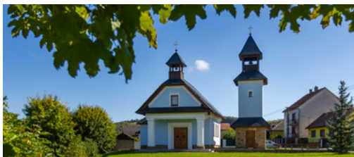
↑ NETRADIČNÍ STAVBA. Kaple sv. Vojtěcha byla postavena i díky iniciativě místních věřících, kteří uspořádali sbírku.

Chloubou obce je jistě nově zrestaurovaná roubená zvonička z 19. století, kterou najdete ve svahu v západní části návsi. Doubravští ji v minulosti postavili jako náhradu za původní shořelou zvoničku. Prohlédněte si i kapli sv. Vojtěcha. V Doubravách stojí teprve od roku 2011. Má netradiční podobu – je rozdělená na dvě části, samostatně stojící 12 metrů vysokou zvonici coby symbol muže a vlastní kapli, která je