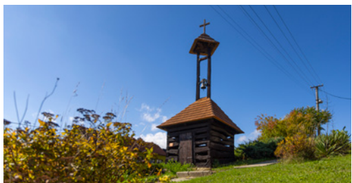
↑ ZVONIČKA. Drobnou roubenou zvoničku najdete v západní části návsi.

Při návštěvě Doubrav se zajděte podívat k domu číslo 21, který se nachází asi pět minut chůze z centra obce, a to po levé straně cesty směrem na Zlín. U usedlosti stojí komora, která je kulturní památkou České republiky. Nenápad-