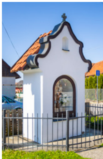
↑ PAMÁTKA. V Topolné stojí kaplička sv. Antonína postavená v roce 1925.

Nad Topolnou se od roku 1951 tyčila vysílací stanice, která šířila rádiový signál Českého rozhlasu po celé Evropě. Stožáry stanice vysoké 270 metrů byly viditelné z dalekého okolí. V roce 2022 však byly oba stožáry řízeně odstraněny. Významnými kulturními památkami jsou pak zemědělské usedlosti č. p. 7, 90 a 93, které se nacházejí v blízkosti obecního úřadu. Dům č. p. 7 je soukromý, domy č. p. 90 a 93 spravuje Slovácké muzeum a sídlí v nich jeho pobočka – Muzeum v přírodě Topolná. Zastavte se rovněž