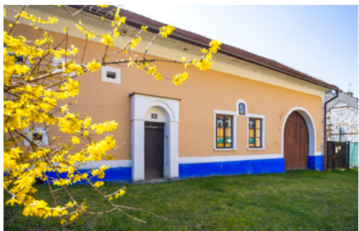
↑ LIDOVÉ BYDLENÍ. Zemědělská usedlost č. p. 93 patří k typickým ukázkám selského stavení z 19. století.

Dodnes má v místě velkou tradici zemědělství. Obecním symbolům dominuje takzvané mluvící znamení stromu – topolu, který provází dvě heraldické růže. Zlatá, nacházející se vpravo, připomíná pány z Hradce, ta levá, stříbrná, zase místní kostelík. A právě od slova topol pochází s největší pravděpodobností i název samotné obce.