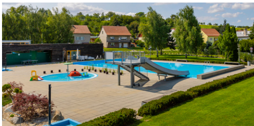
↑ SPORTOVIŠTĚ. Areál nabízí aktivity a zábavu pro všechny věkové kategorie.

Kromě jiného si v Sazovicích můžete prohlédnout tradiční zástavbu, zvonici z roku 1947, nacházející se nedaleko obecního úřadu, sochu Panny Marie nebo třeba kříž na památku obětí z první světové války.