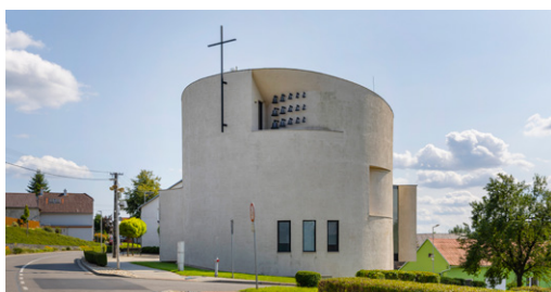
↑ SVATOSTÁNEK. Novodobý kostel sv. Václava vysvětili v Sazovicích v roce 2017.

Kdo se chce s dějinami obce seznámit blíže, může zavítat do místního muzea nacházejícího se v domě č. p. 21, které zachovává zdejší historické předměty a ukazuje charakteristický styl života