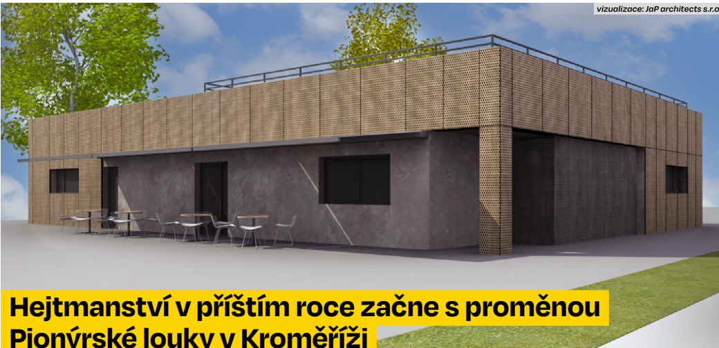
vizualizace: J&amp;P architects s.r.o.