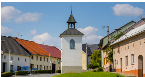
↑ ZVONICE. Nedaleko obecního úřadu se nachází zvonice z roku 1947.