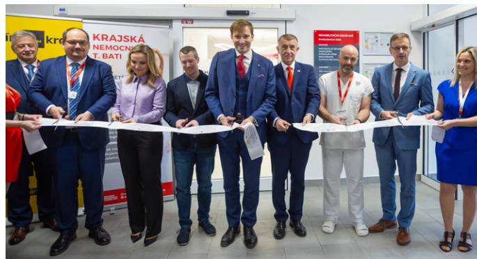
↑ STŘIHÁNÍ PÁSKY. Slavnostního otevření nových prostor se zúčastnili také premiér Andrej Babiš a ministr zdravotnictví Adam Vojtěch.