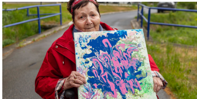
↑ VLASTNÍ TVORBA. Součástí osobní asistence může být i společné malování.

Výhodou osobní asistence je i pravidelnost a jistota. Pokud péči zajišťuje registrovaná sociální služba, klient ví, že se mu