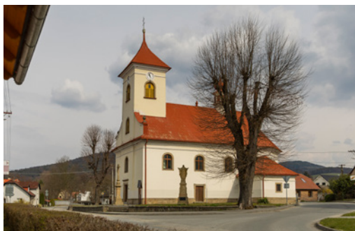
↑ SVATOSTÁNEK. Kostel sv. Kateřiny se nachází v centru obce.

První písemná zmínka o obci pochází z roku 1440, ale region už lidé kolonizovali i dříve. Kašava vznikla coby nová osada díky čilému ruchu okolo blízkého hradu Lukov. Původně ji vlastnili Šternberkové a byli to právě oni, kdo vesnici vybrali patronku – stala se jí Kateřina Alexandrijská. Původně zdejší obyvatelé, kteří žili v prostých, roubených domech ze dřeva, pracovali v lesích. Živil se však také pastevectvím a s rozvojem firmy Tomáše Bati se ve 20. století hojně věnovali rovněž obuvnictví.