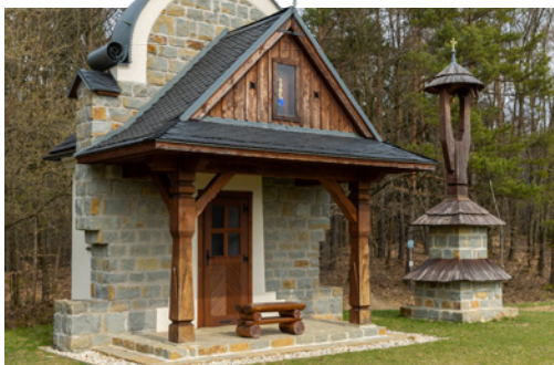
↑ MÍSTO ZASTAVENÍ. Kaple Panny Marie na Vinohrádku byla vysvěcena v roce 2020.

Vystoupat můžete také na vrch Kopná. Ten nejenže vévodí okolním kopcům, ale dal rovněž