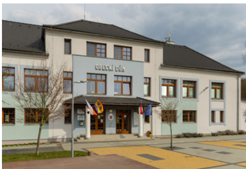
↑ OBECNÍ ÚŘAD. V budově slouží místním například i knihovna.

jméno zdejších závodů v rally. Anebo se zajděte podívat na přírodní památku Nad Kašavou, jež je součástí soustavy chráněných území Natura 2000. Rozprostírá se nalevo od křížové cesty a žluté turistické značky.